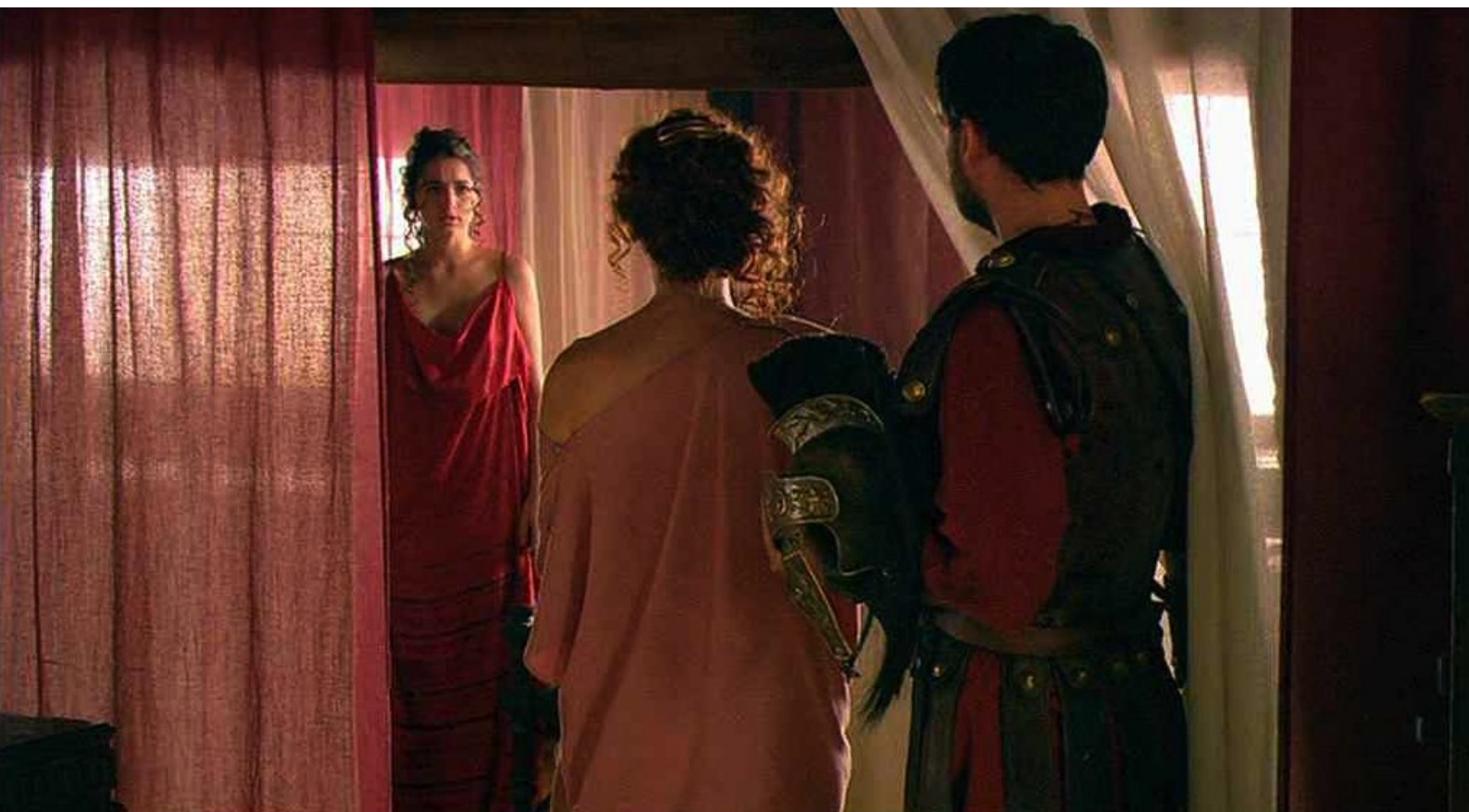
Hispania, la Leyenda : au grand déplaisir de Claudia,