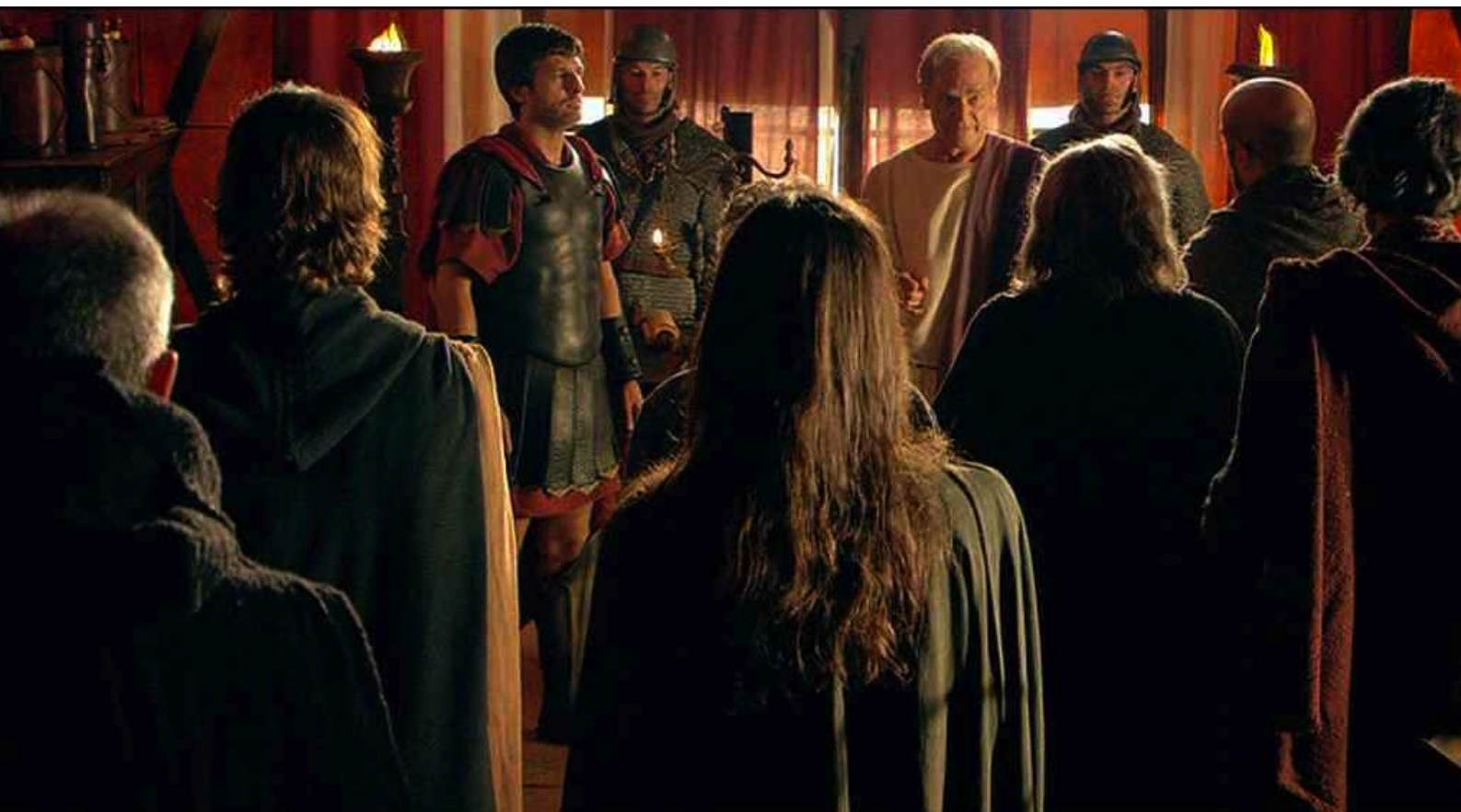
Hispania, la Leyenda : peut faire partie de ce conseil...