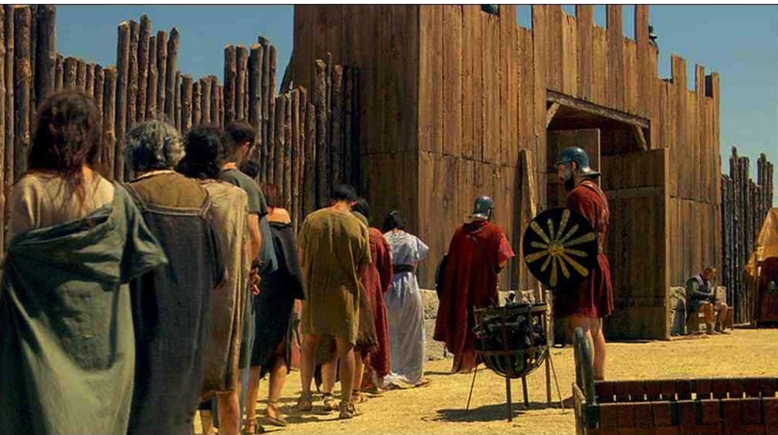
Hispania, la Leyenda : et les font sortir du camp ;