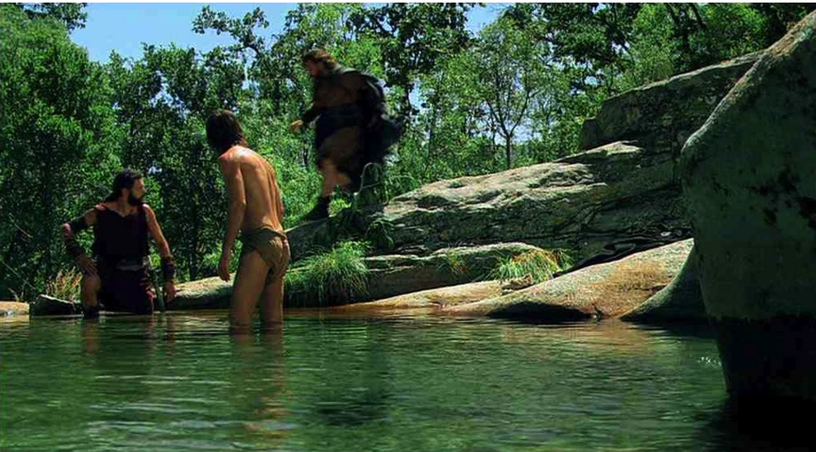
Hispania, la Leyenda : Viriate envoie Dario au conseil des anciens,

Comme portfolios du numéro 46 de La 12 e Heure , nous vous offrons plusieurs florilèges de photos tirées des épisodes de la série Hispania, la Leyenda , à laquelle nous avons consacré le dossier du numéro 46 de notre fanzine.