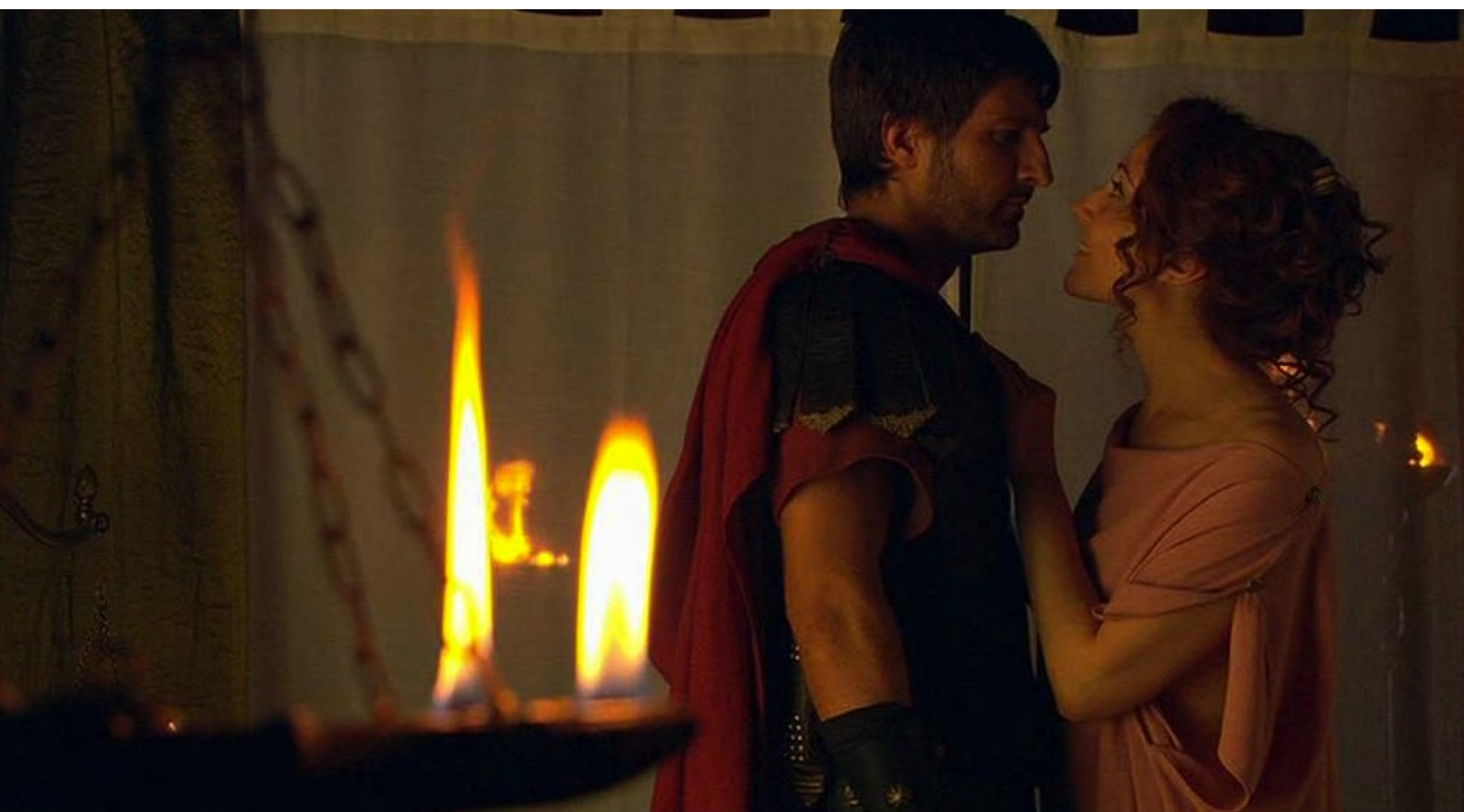
Hispania, la Leyenda : Dès lors, pour récompenser Marco, Claudia décide de le séduire.