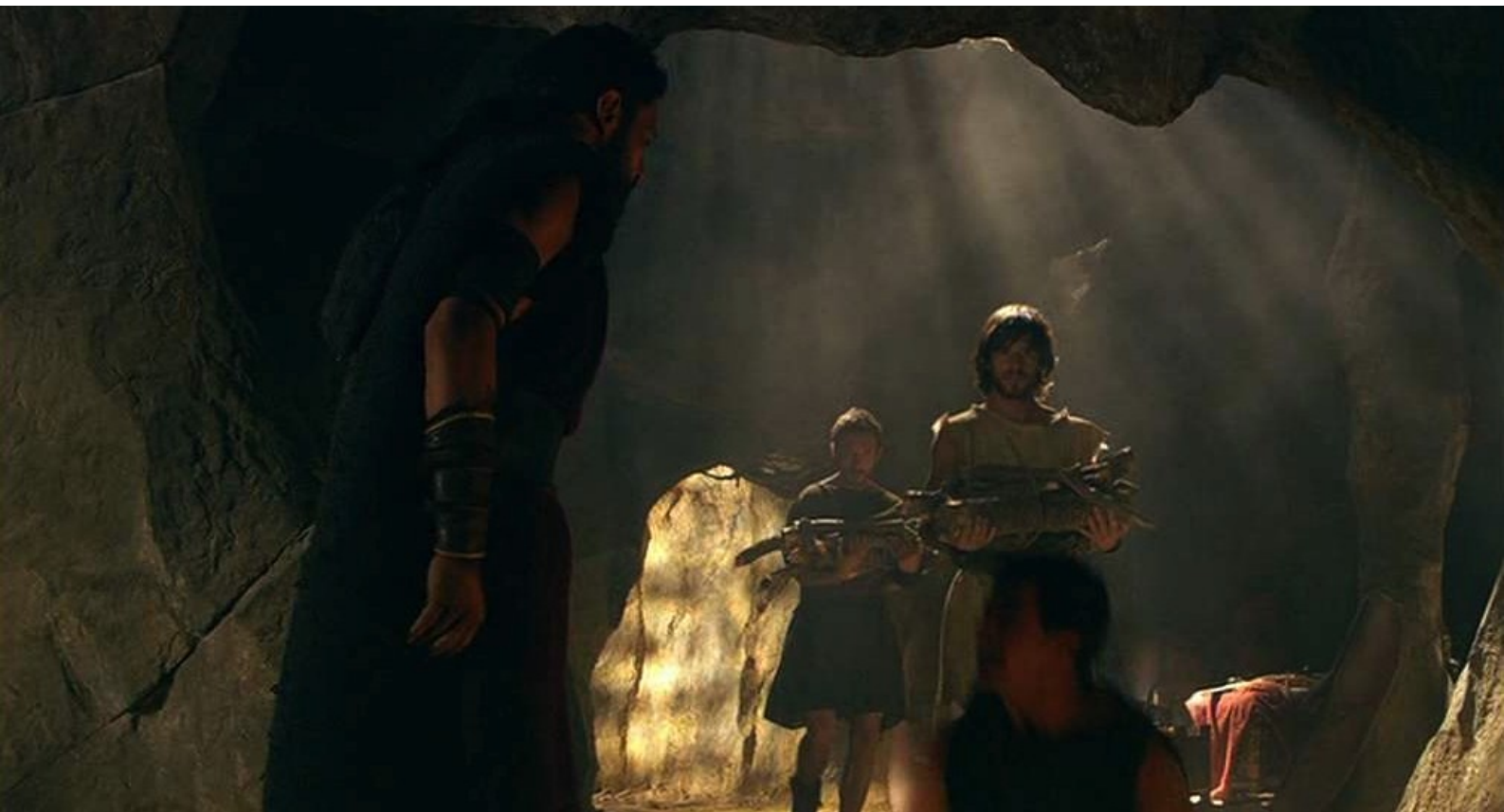
Hispania, la Leyenda : tandis que des rebelles amènent dans la caverne du bois pour leur feu.