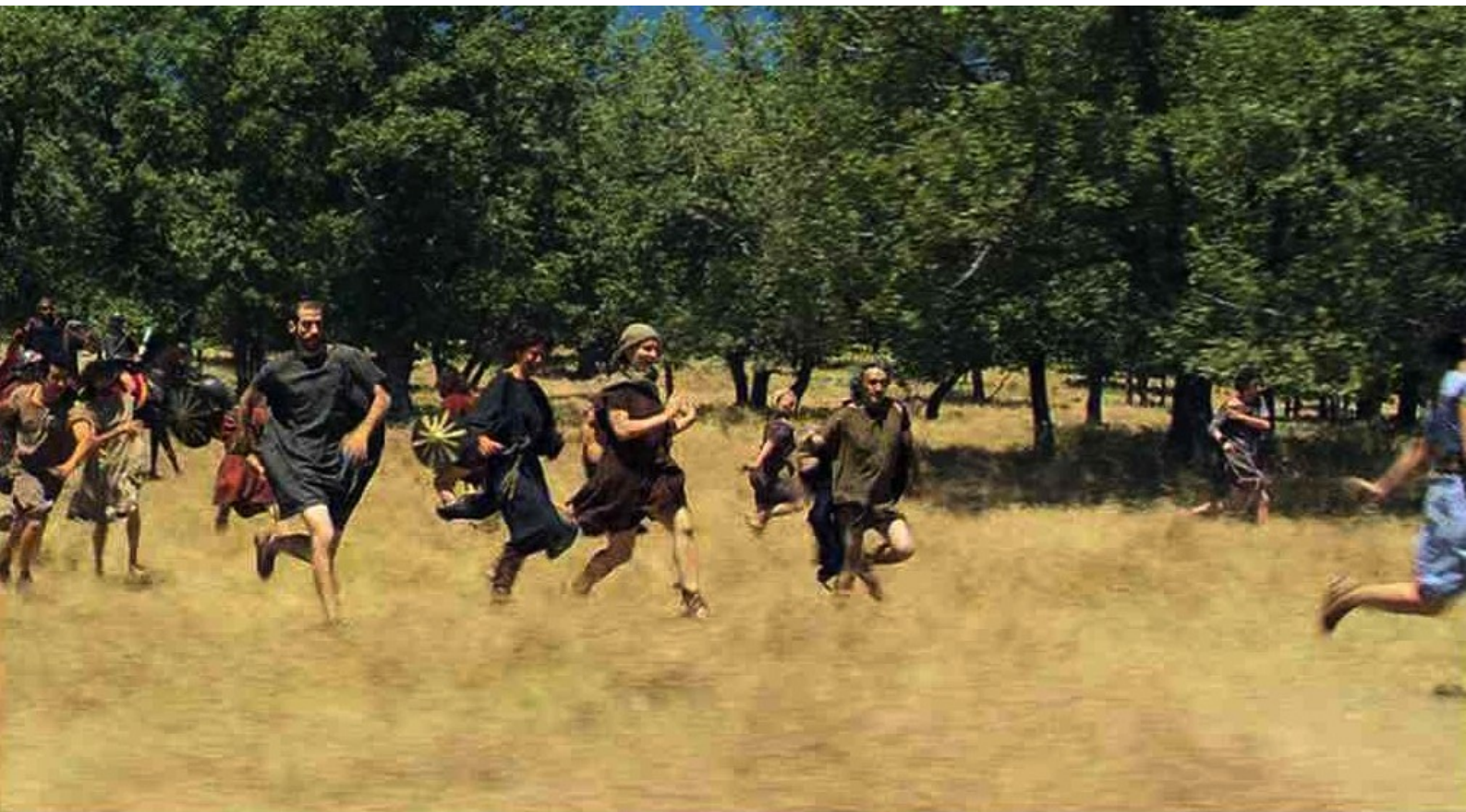
Hispania, la Leyenda : mais, surpris par une patrouille, ils s'enfuient,