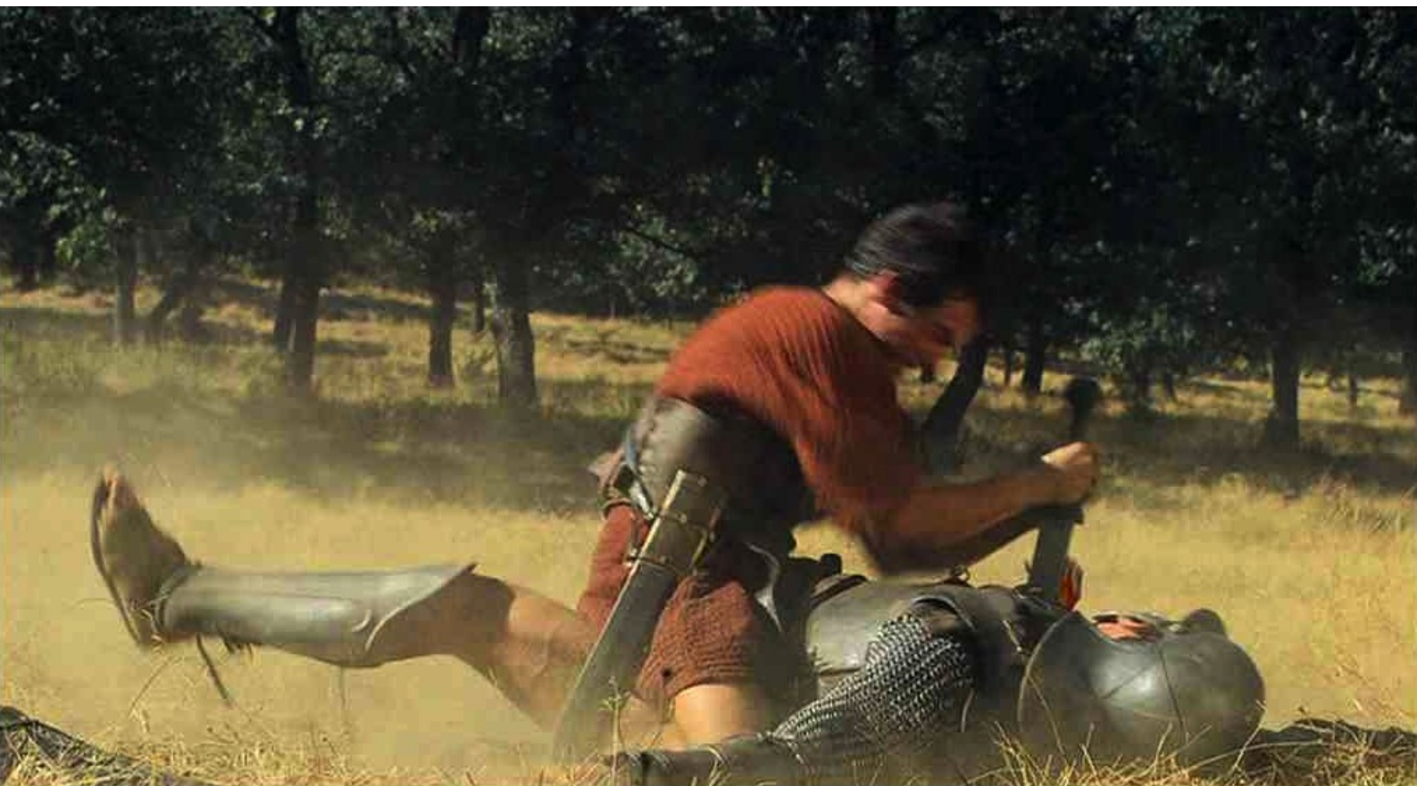
Hispania, la Leyenda : tandis que Paulo tue un légionnaire.