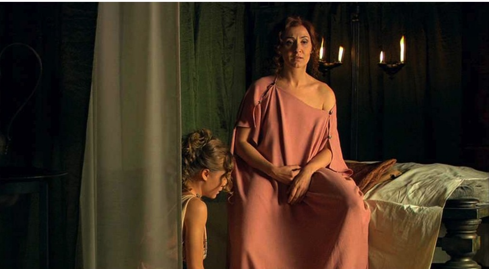
Hispania, la Leyenda : qui rumine sa rancune et,