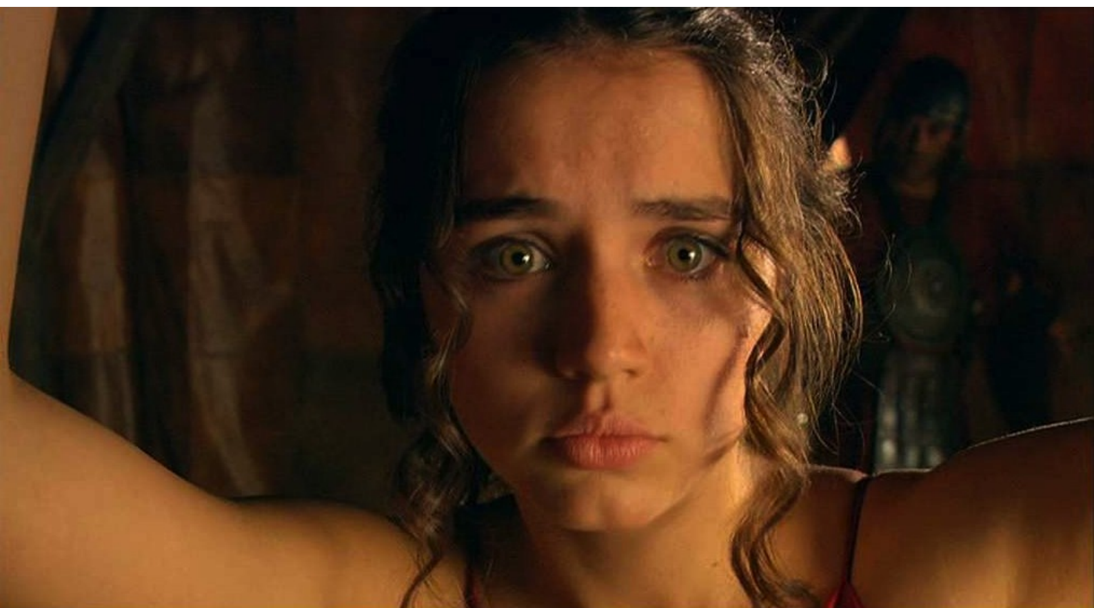
Hispania, la Leyenda : ce qui effraie la jeune fille ;