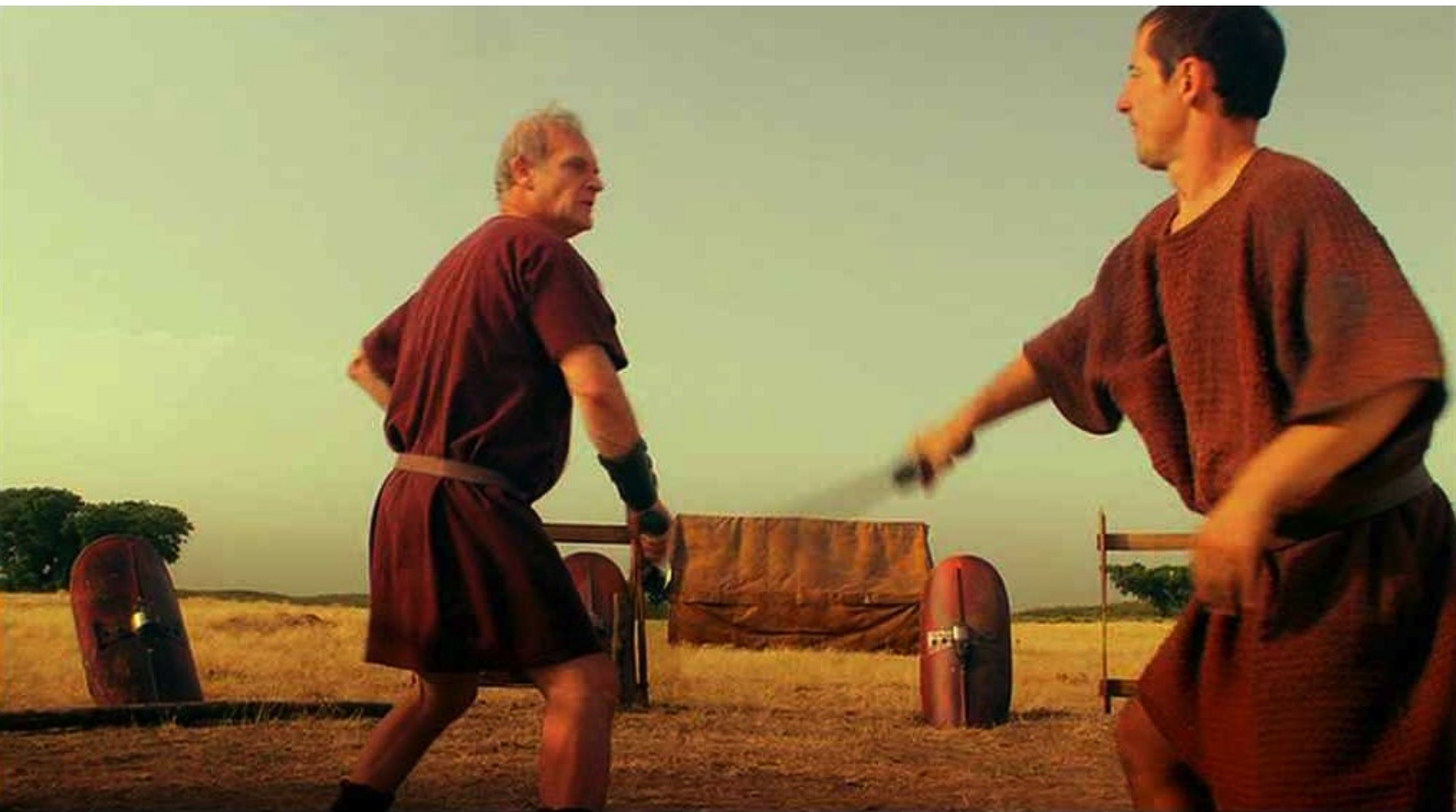
Hispania, la Leyenda : son mari qui s'entraîne avec les soldats,