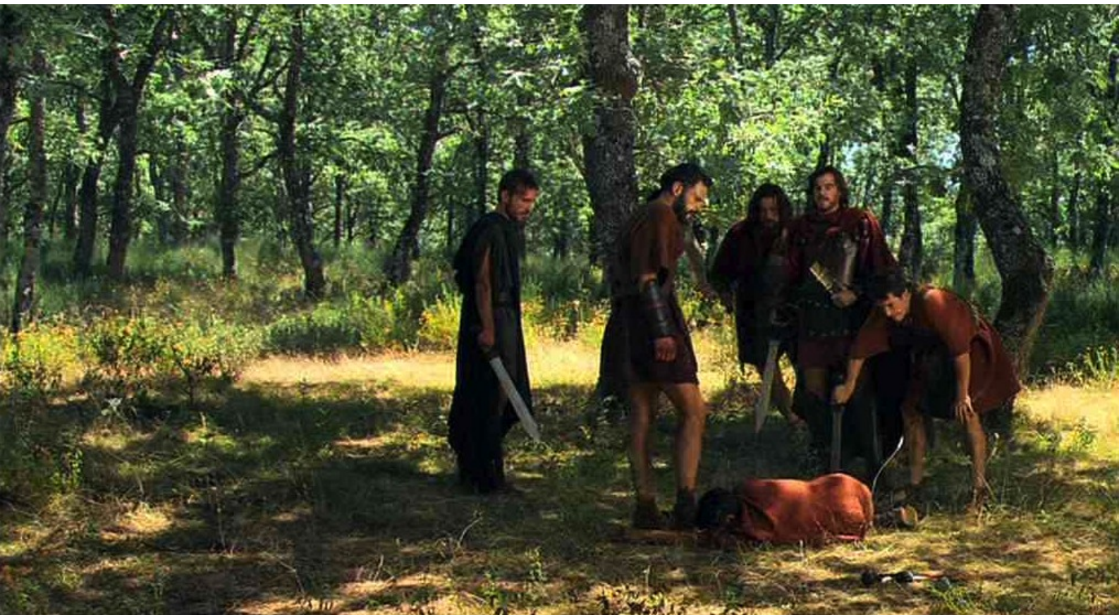
Hispania, la Leyenda : et contemplant son cadavre.