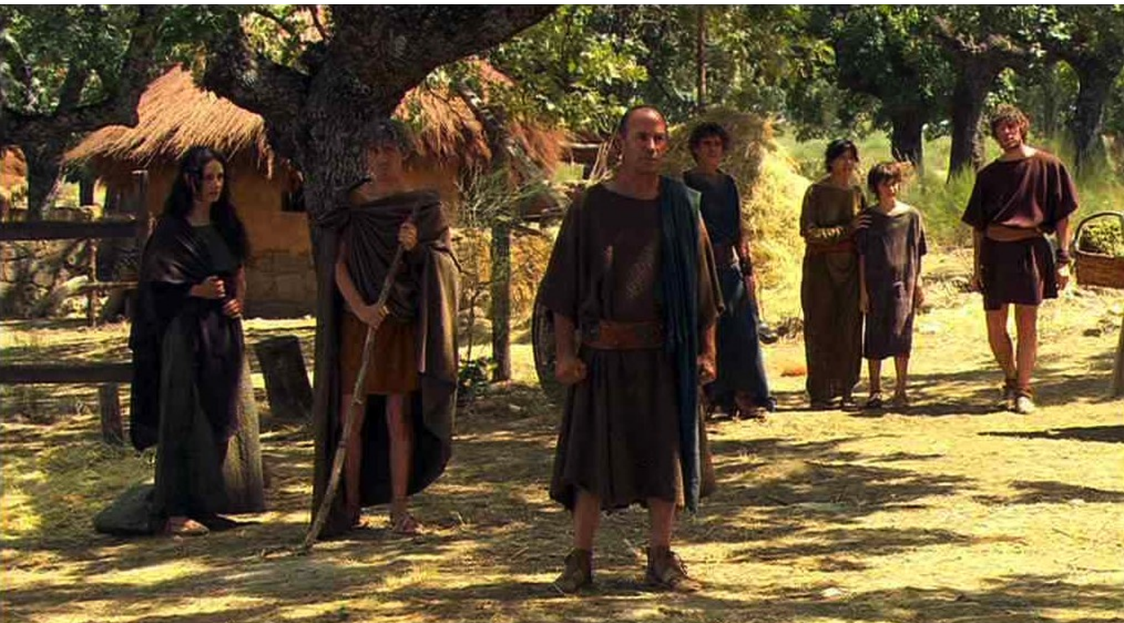
Hispania, la Leyenda : et des villageois présents.