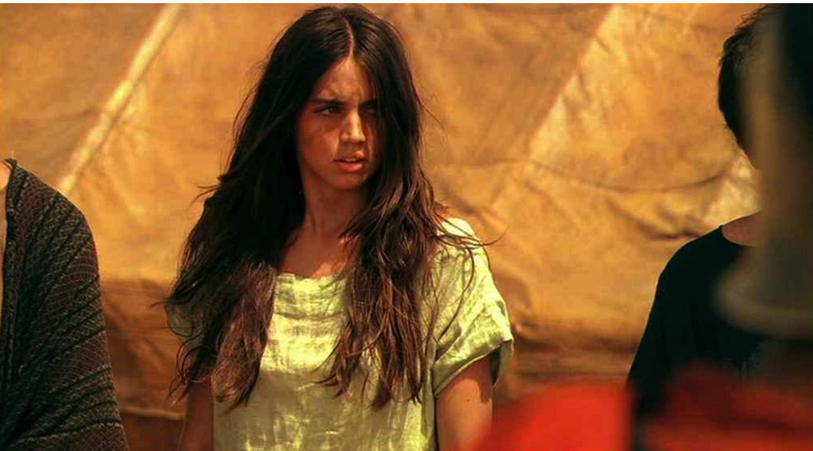
Hispania, la Leyenda : Tandis que Nerea est prisonnière au camp,