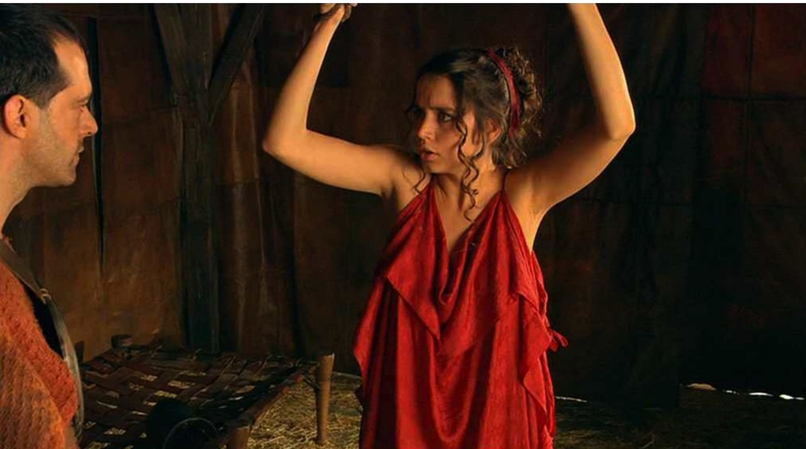
Hispania, la Leyenda : Puis il la fait attacher dans une autre tente ;