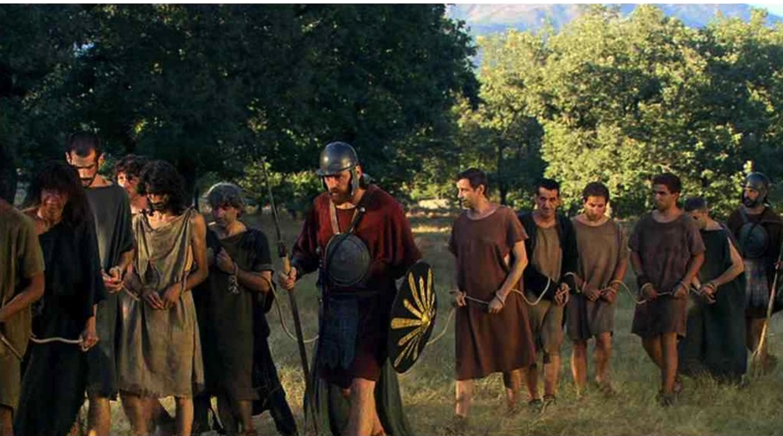
Hispania, la Leyenda : Alors les autres s'éloignent lentement,