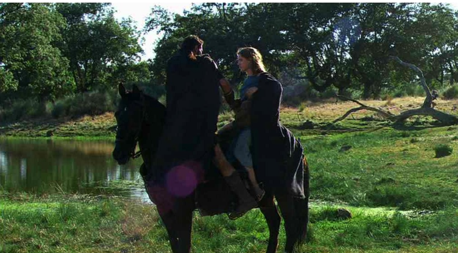
Hispania, la Leyenda : Quand Viriate ramène Helena au village,