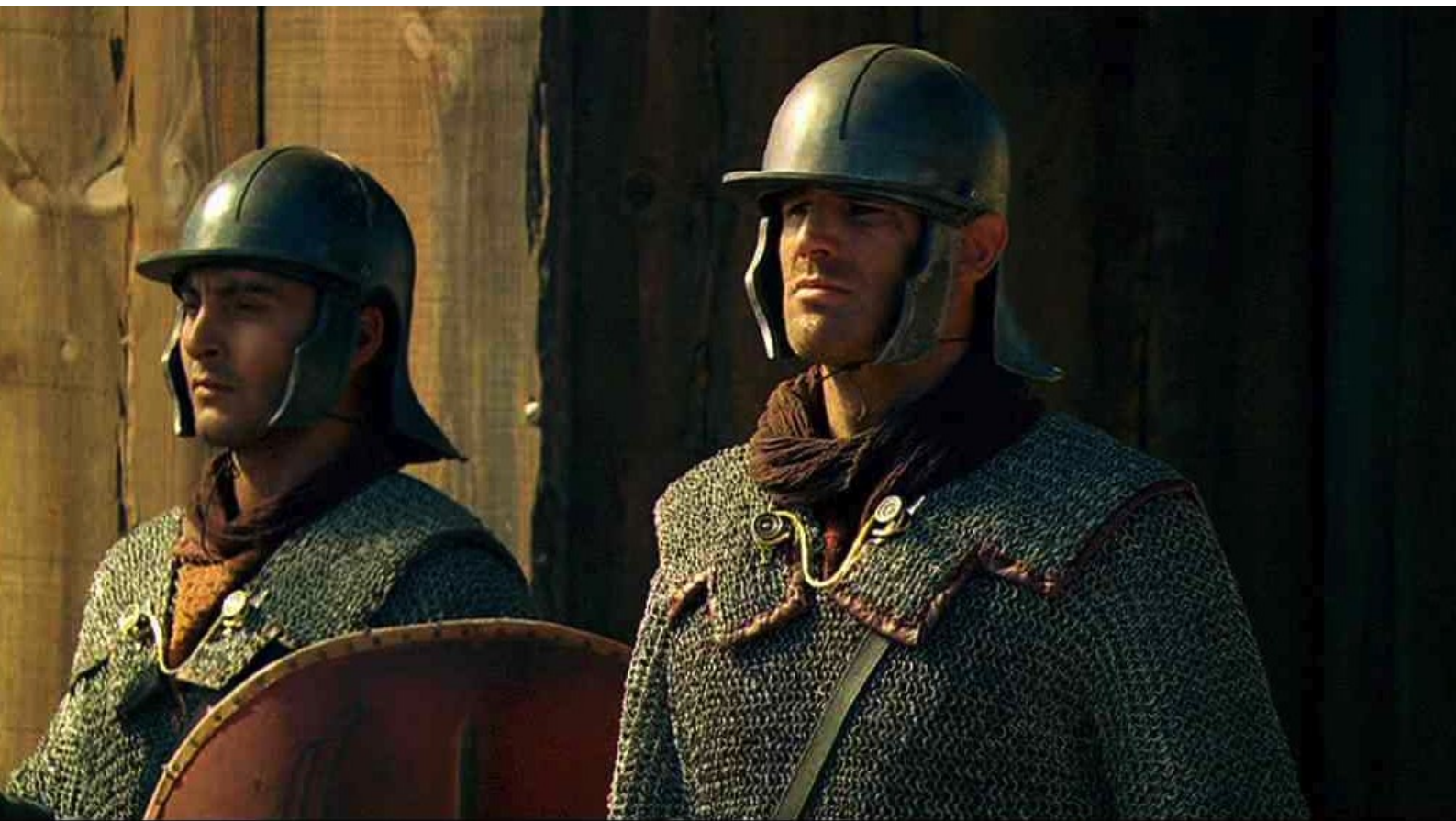
Hispania, la Leyenda : berner les sentinelles...