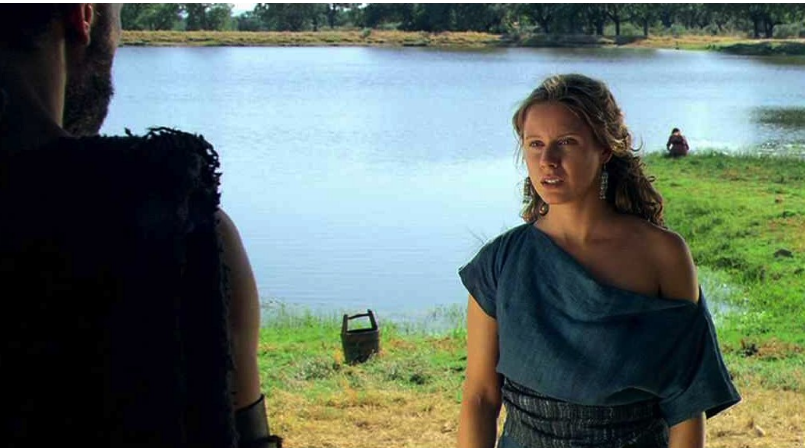
Hispania, la Leyenda : il lui demande de venir soigner le blessé...