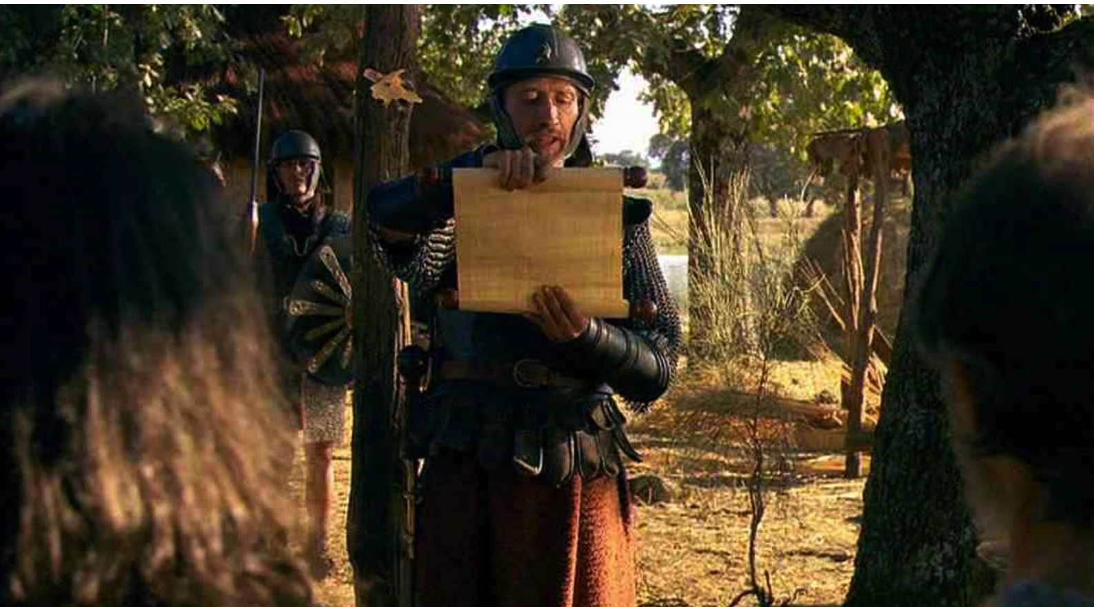
Hispania, la Leyenda : puis il fait promettre une grosse récompense si on lui livre...