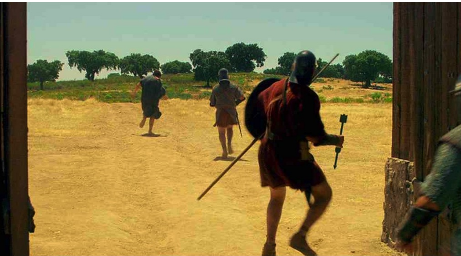
Hispania, la Leyenda : mais, paniqué, l'un d'entre eux fuit et est tué par un javelot romain.