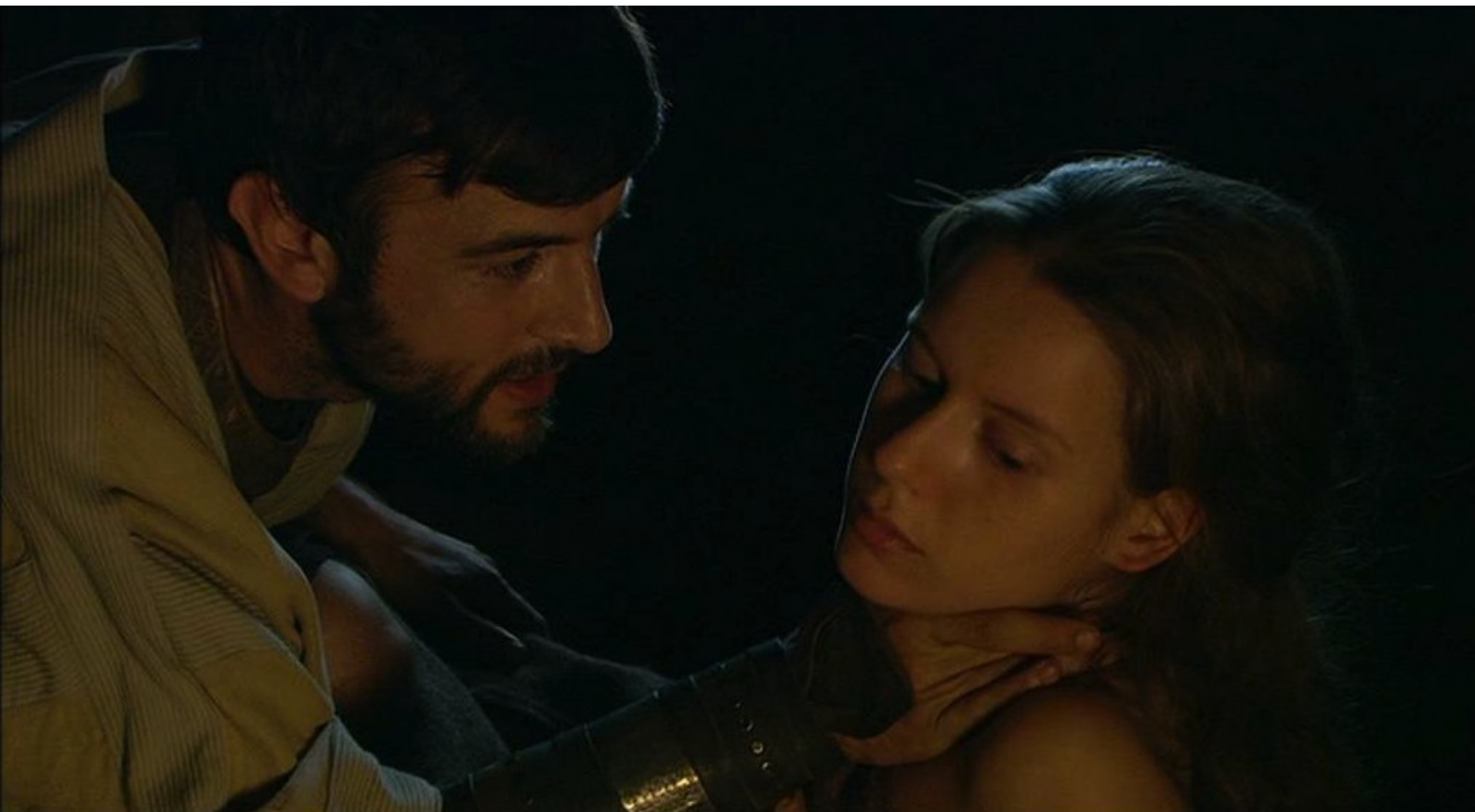
Hispania, la Leyenda : De plus, comble de malheur, Alejo se glisse nuitamment dans sa chambre...