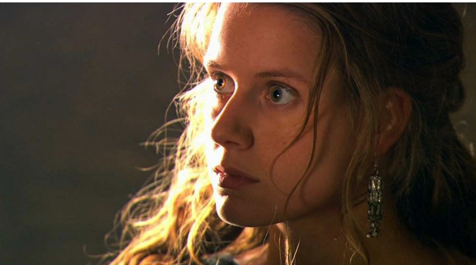
Hispania, la Leyenda : quand son père lui apprend cet accord, elle est choquée,