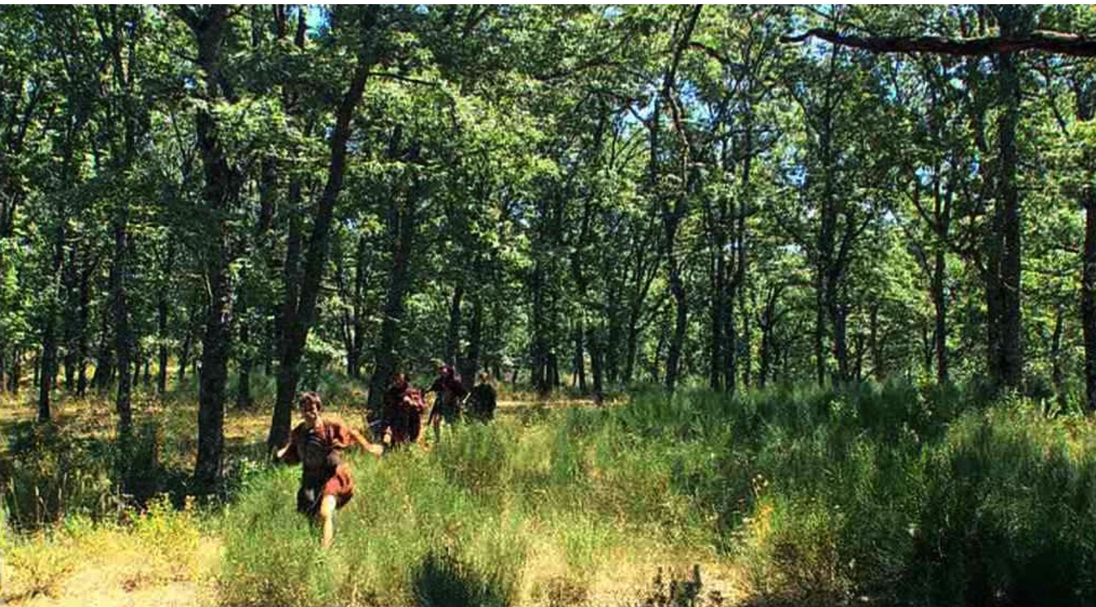
Hispania, la Leyenda : les rebelles le poursuivent,