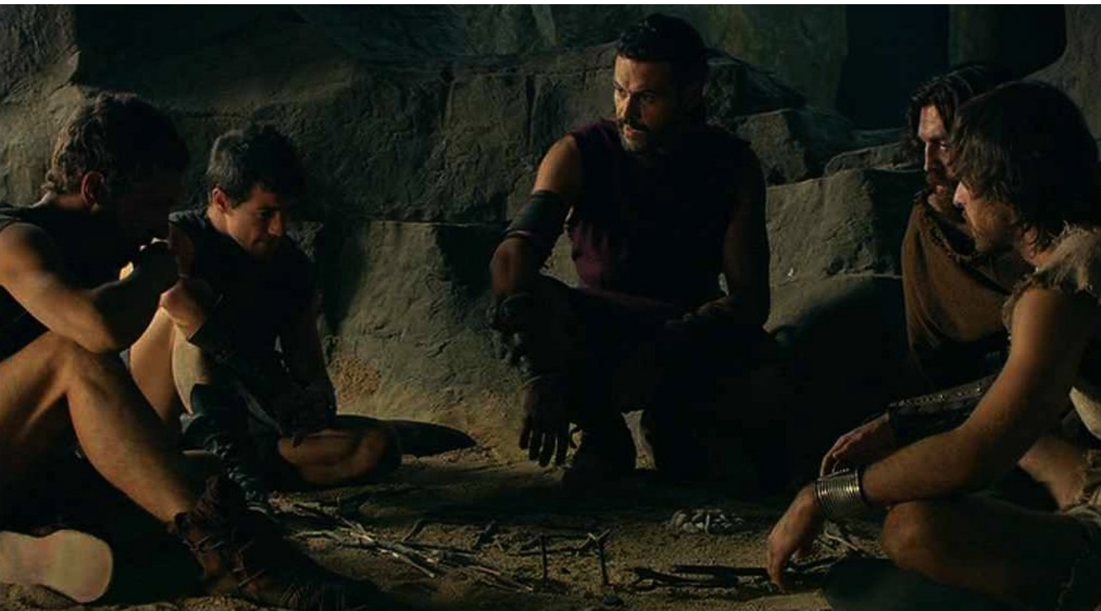
Hispania, la Leyenda : Grâce aux renseignements de Lucio Gabinio, les rebelles font un plan :