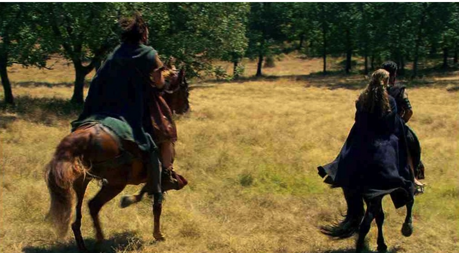
Hispania, la Leyenda : et l'emmène en croupe.