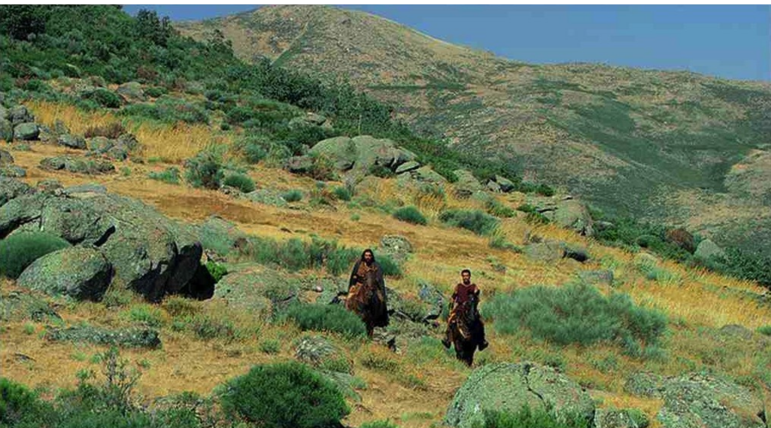
Hispania, la Leyenda : Viriate qui reste en liberté avec ses compagnons.