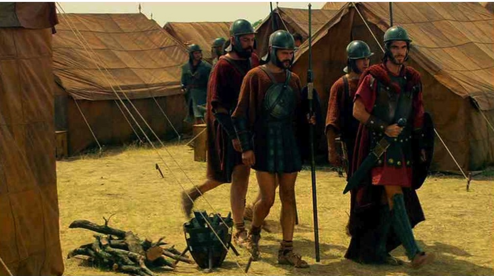
Hispania, la Leyenda : et entrer au milieu des tentes ;