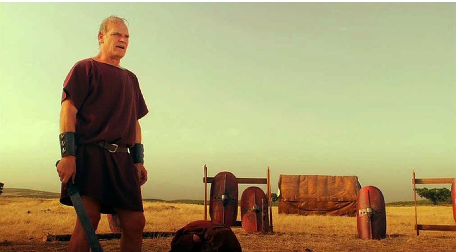
Hispania, la Leyenda : l'interrompt...