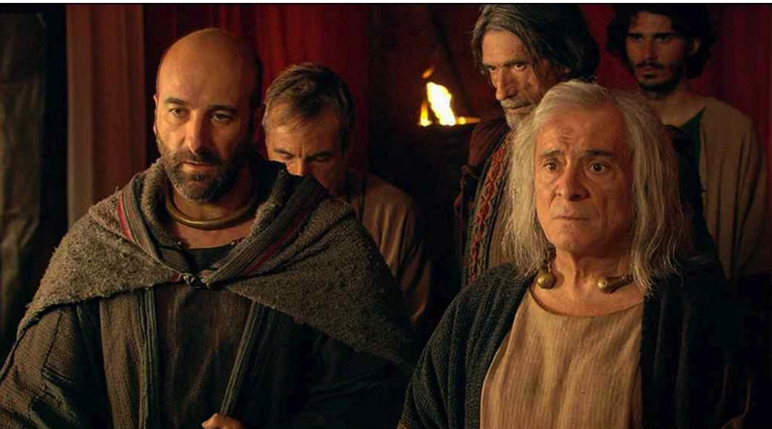
Hispania, la Leyenda : car Dario, fils du chef Césaró,