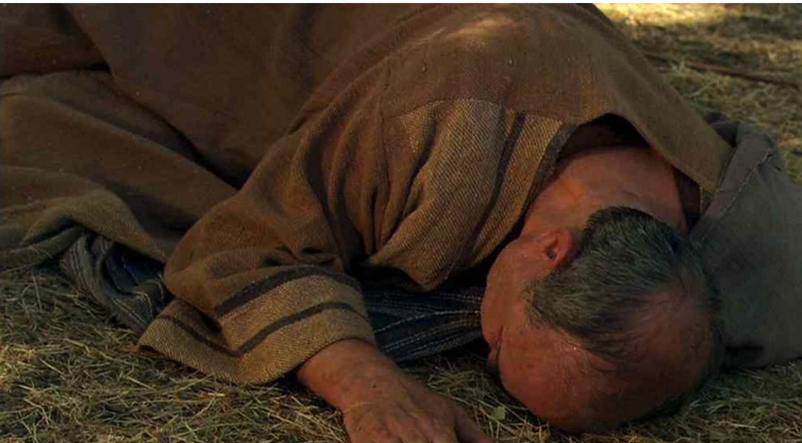
Hispania, la Leyenda : et fait tomber son cadavre sur le sol,