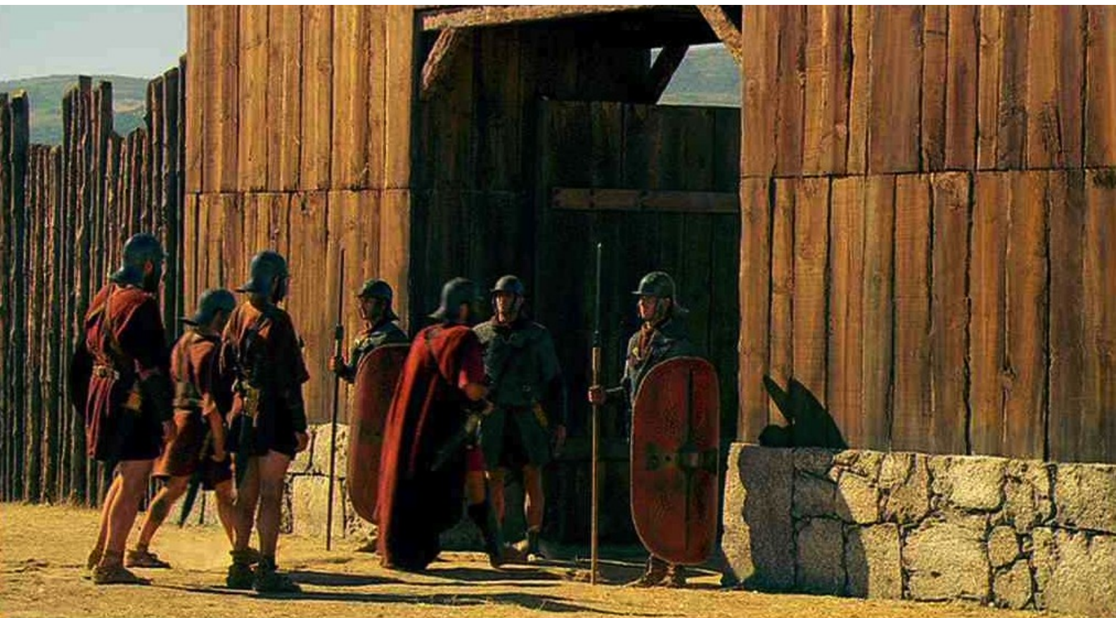
Hispania, la Leyenda : ils se rendent à la porte du camp...