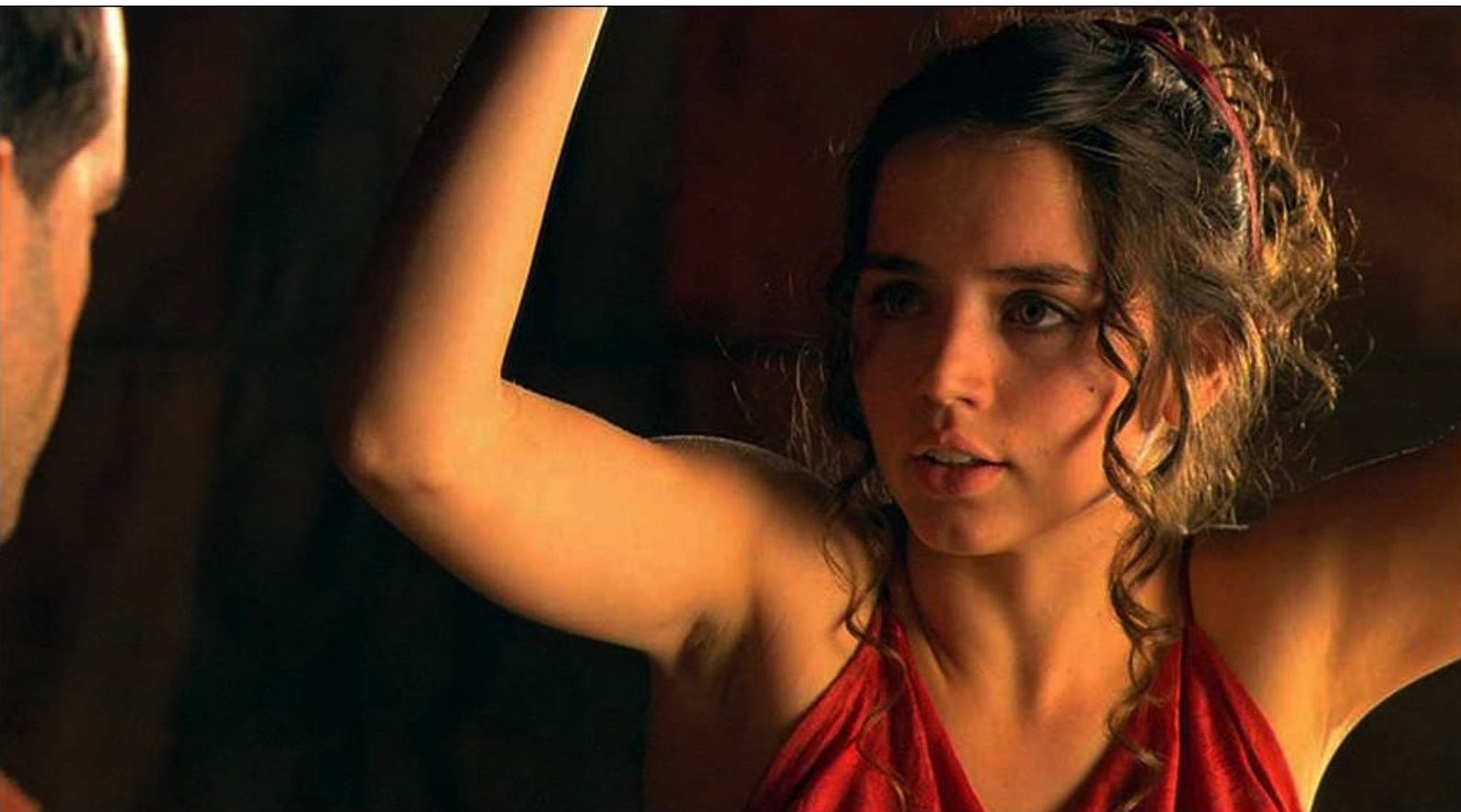
Hispania, la Leyenda : mais un soldat survient,