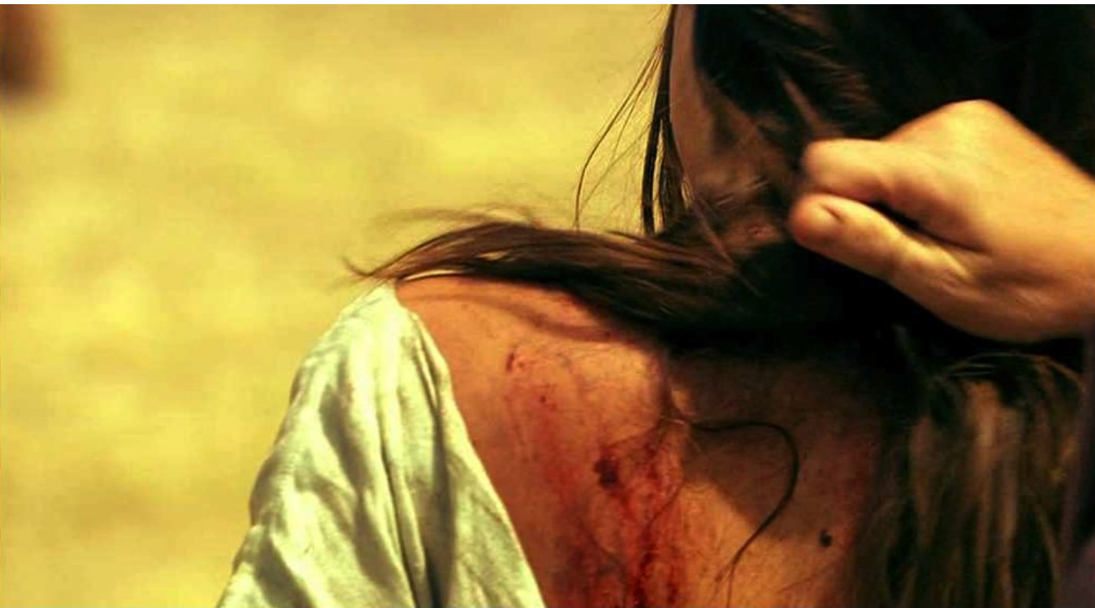
Hispania, la Leyenda : et voit qu'elle a été fouettée pour avoir essayé de fuir ;