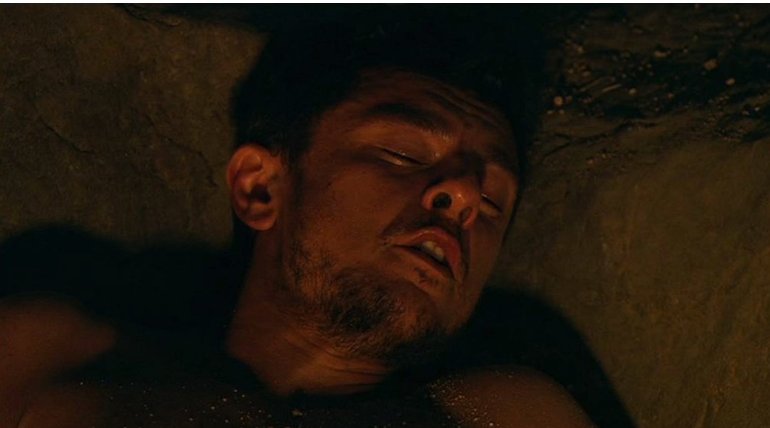
Hispania, la Leyenda : Elle trouve le Romain souffrant...