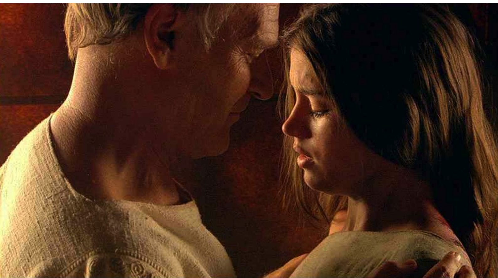
Hispania, la Leyenda : Dès lors, Galba veut en faire sa maîtresse,