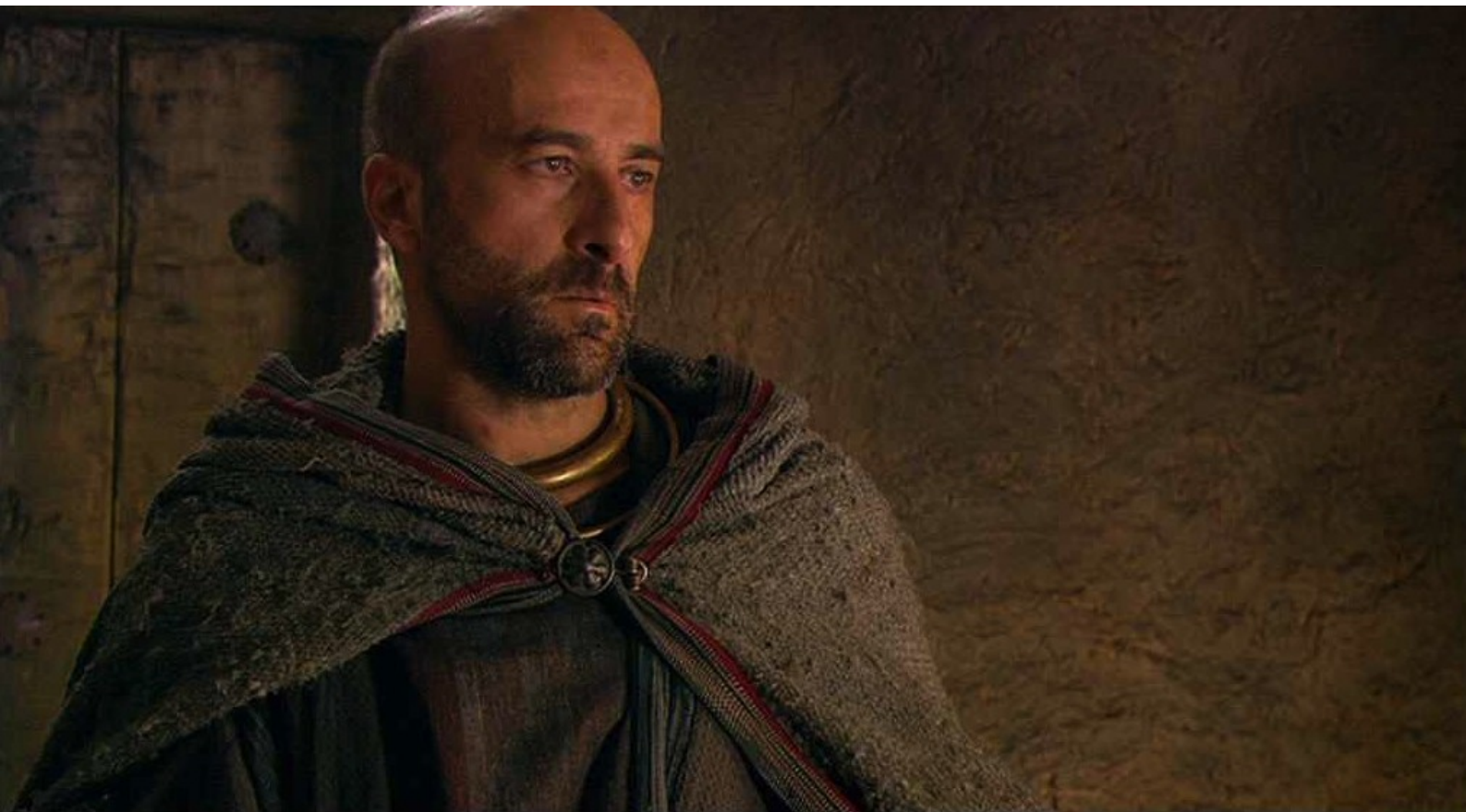
Hispania, la Leyenda : Quant au cupide et lâche Teodoro,