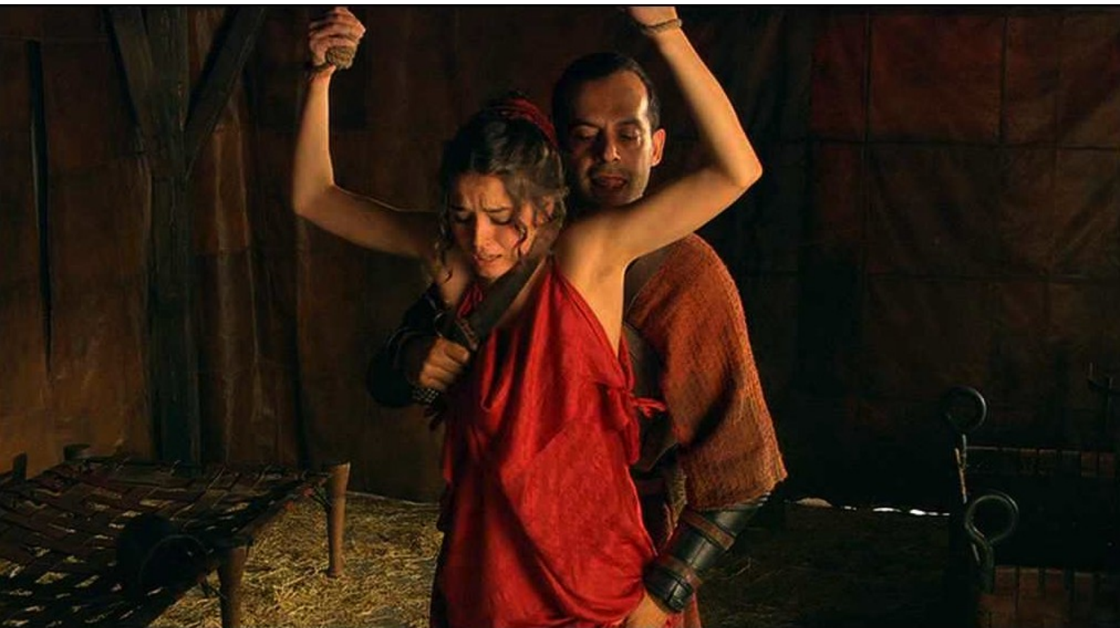
Hispania, la Leyenda : il s'approche menaçant...