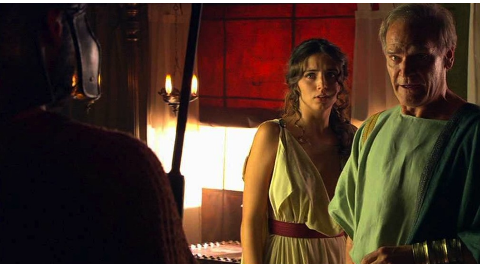
Hispania, la Leyenda : la garde à ses côtés,