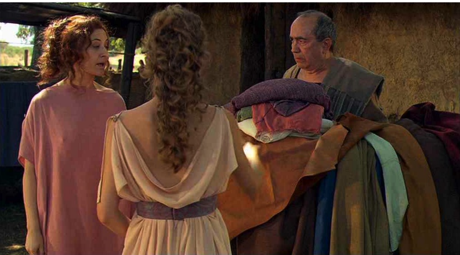
Hispania, la Leyenda : Puis elle va chercher des beaux tissus...