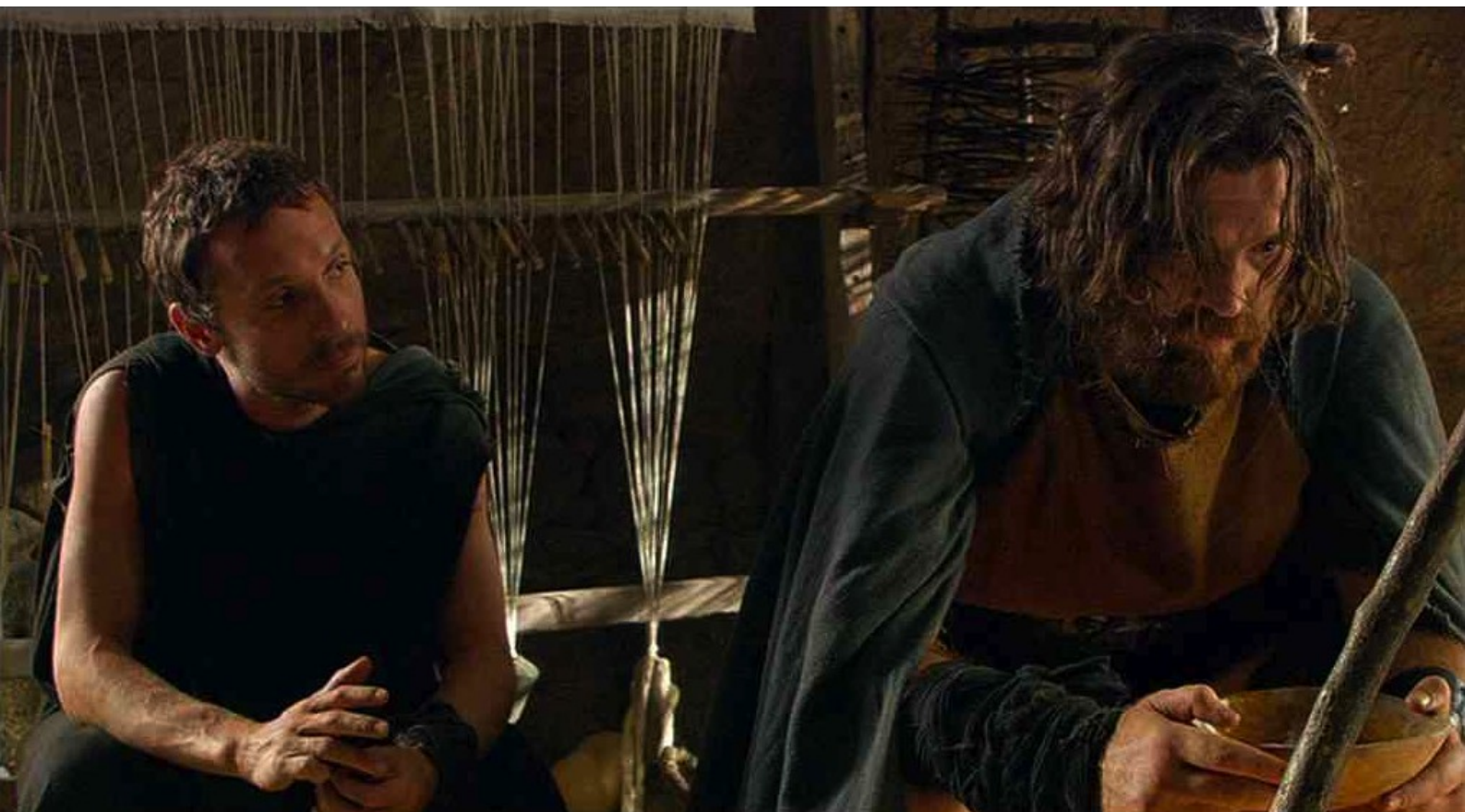
Hispania, la Leyenda : Hector, le frère douteux de Sandro,