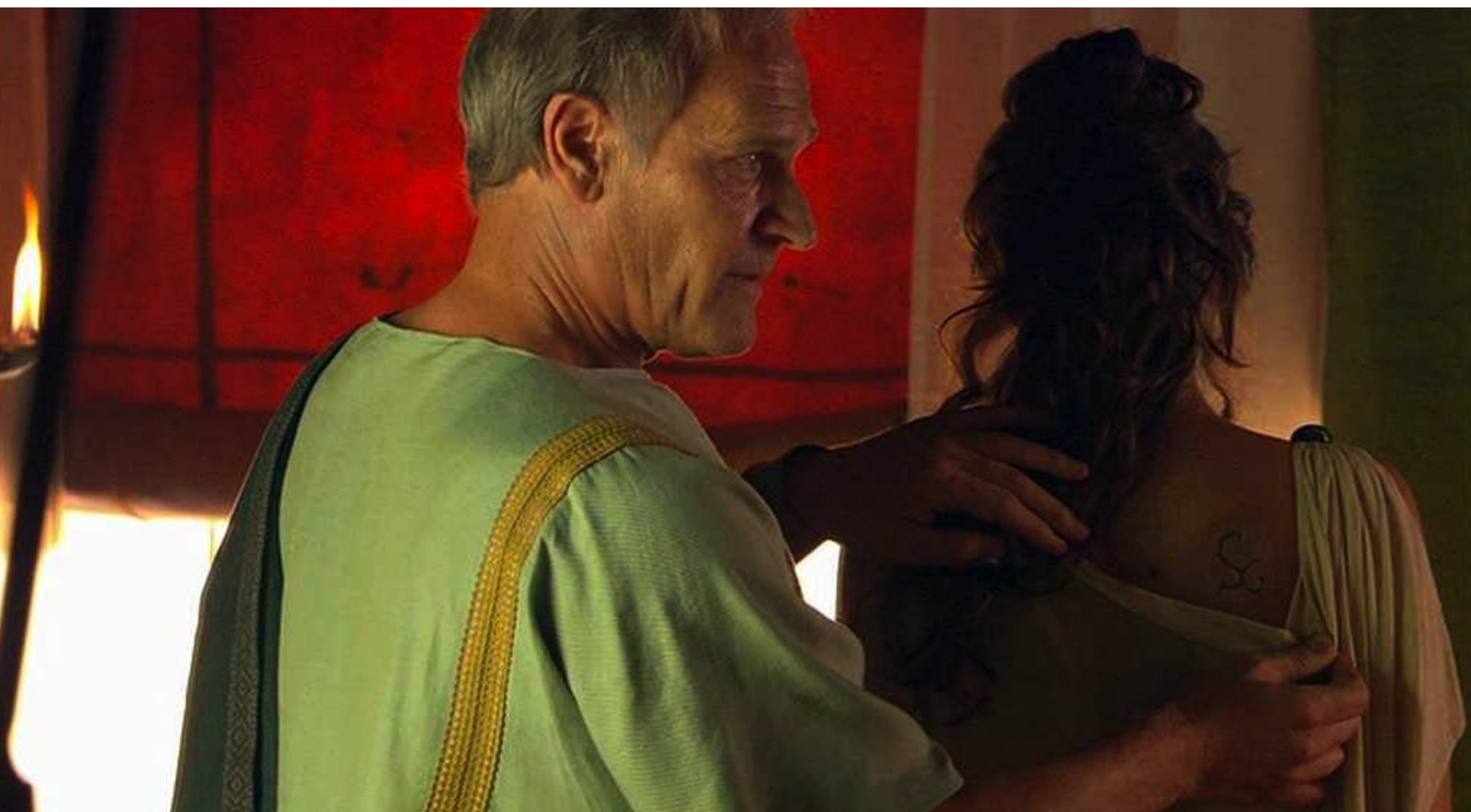
Hispania, la Leyenda : la fait marquer au fer rouge pour qu'elle soit son objet,