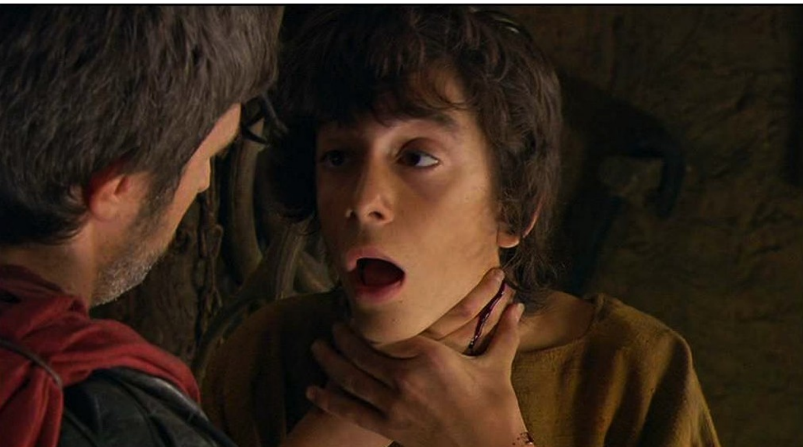
Hispania, la Leyenda : et l'égorge sous les yeux de sa mère et de son frère ;