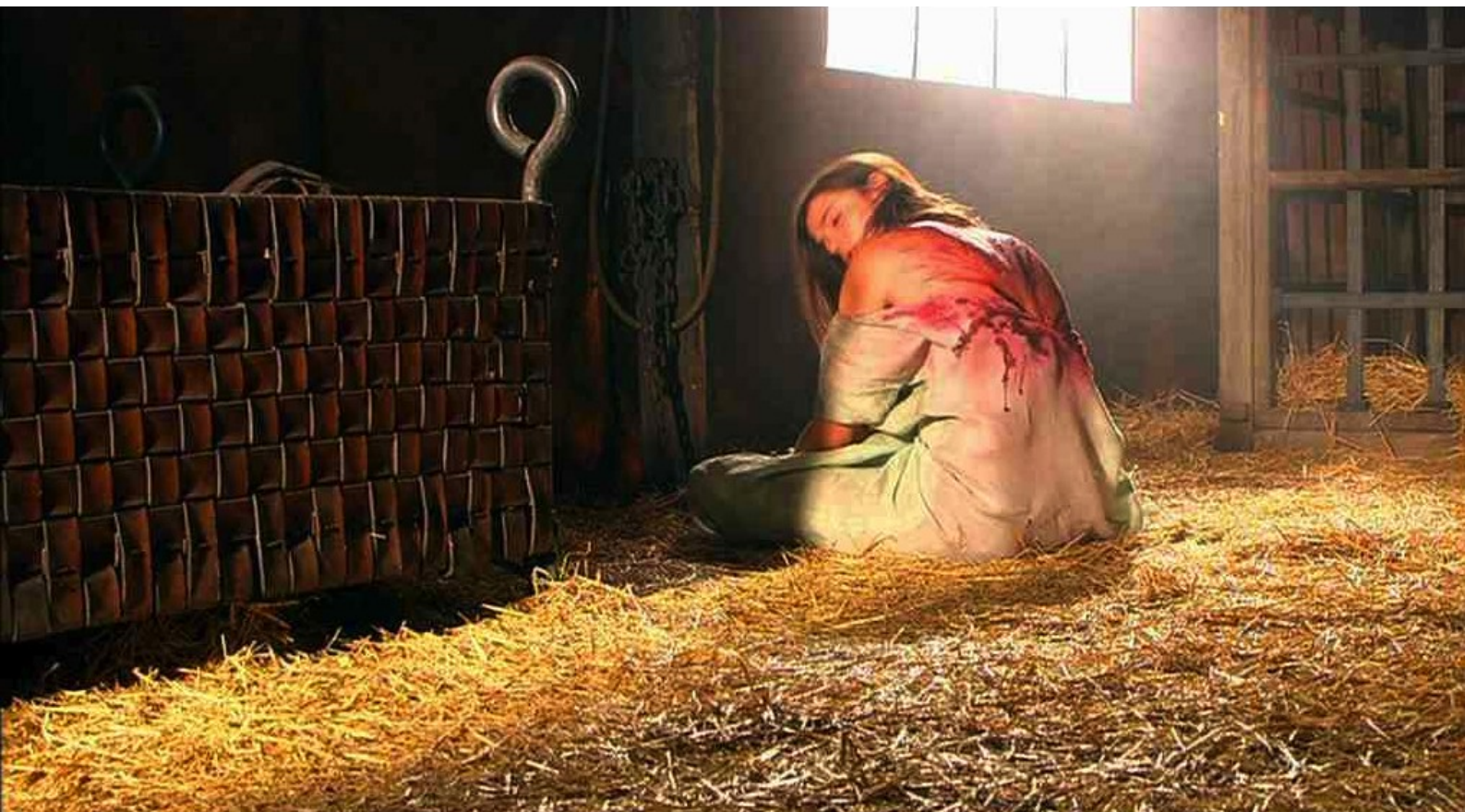
Hispania, la Leyenda : il la fait mettre dans une tente à part...