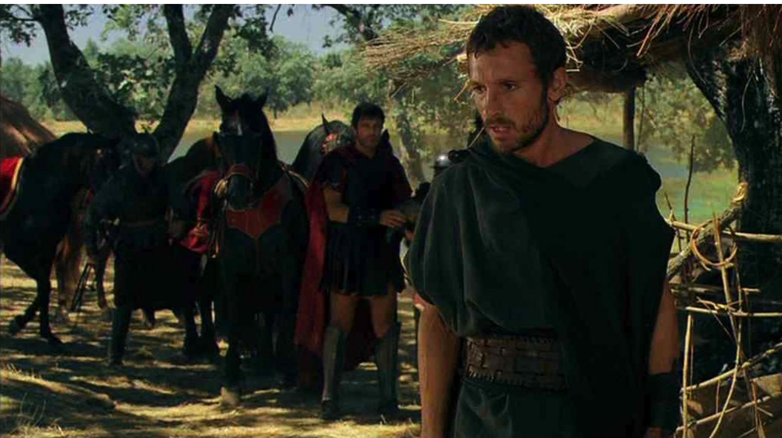
Hispania, la Leyenda : et les perd en passant par le village de Caura.