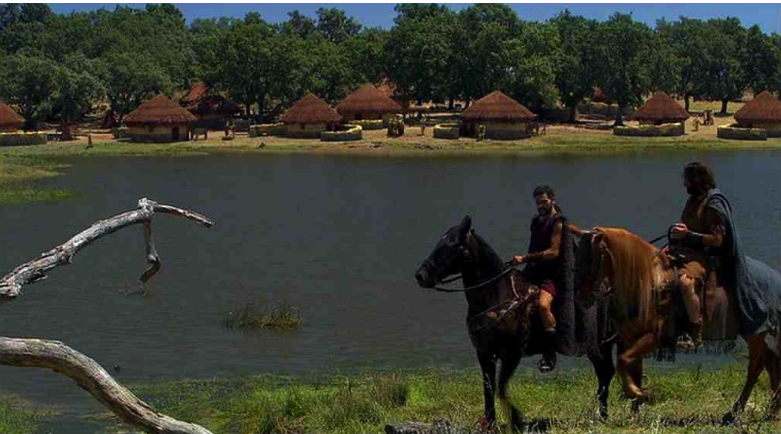
Hispania, la Leyenda : Alors Viriate, avec Sandro, va au village chercher...