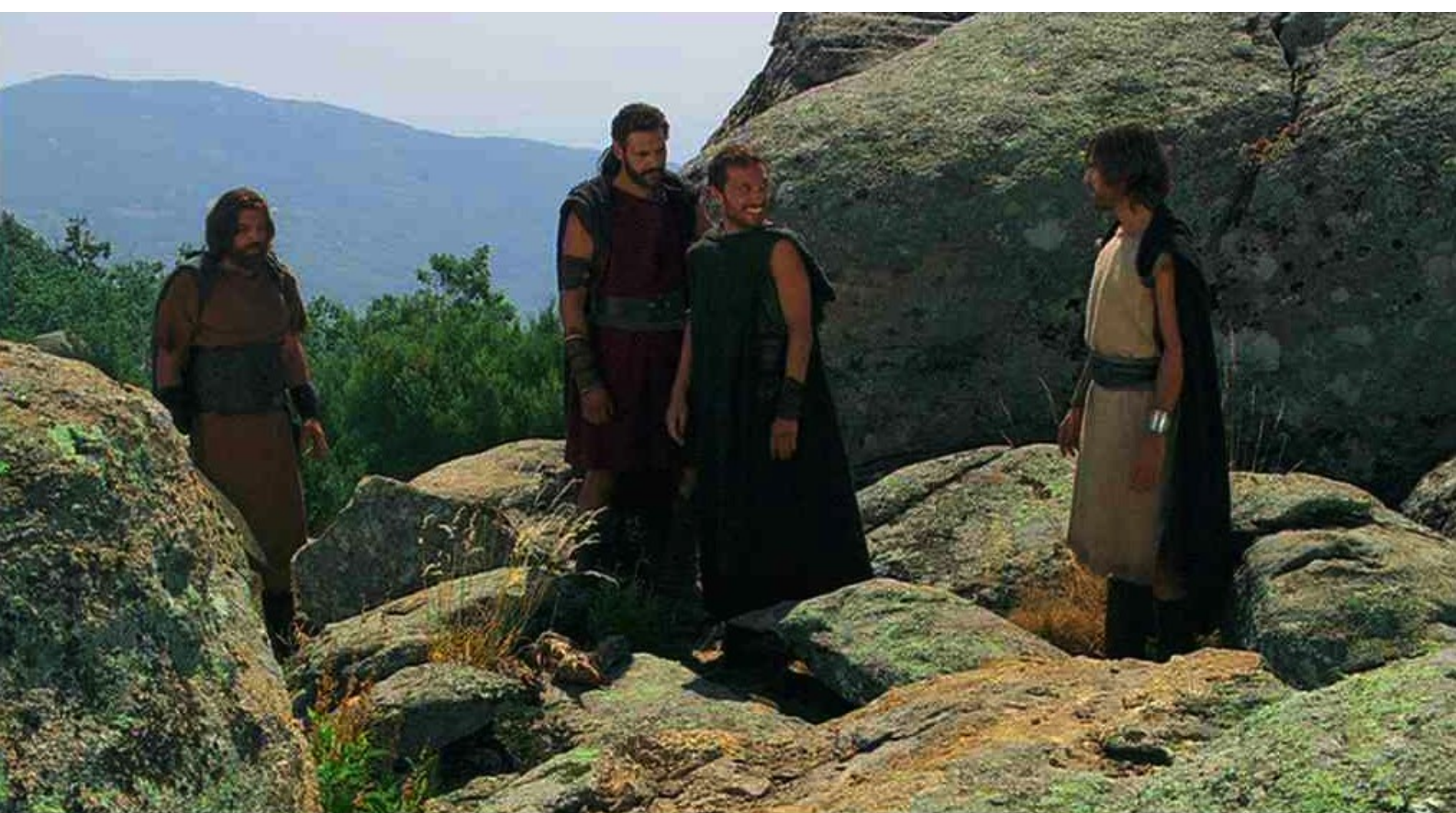
Hispania, la Leyenda : rejoint les rebelles...