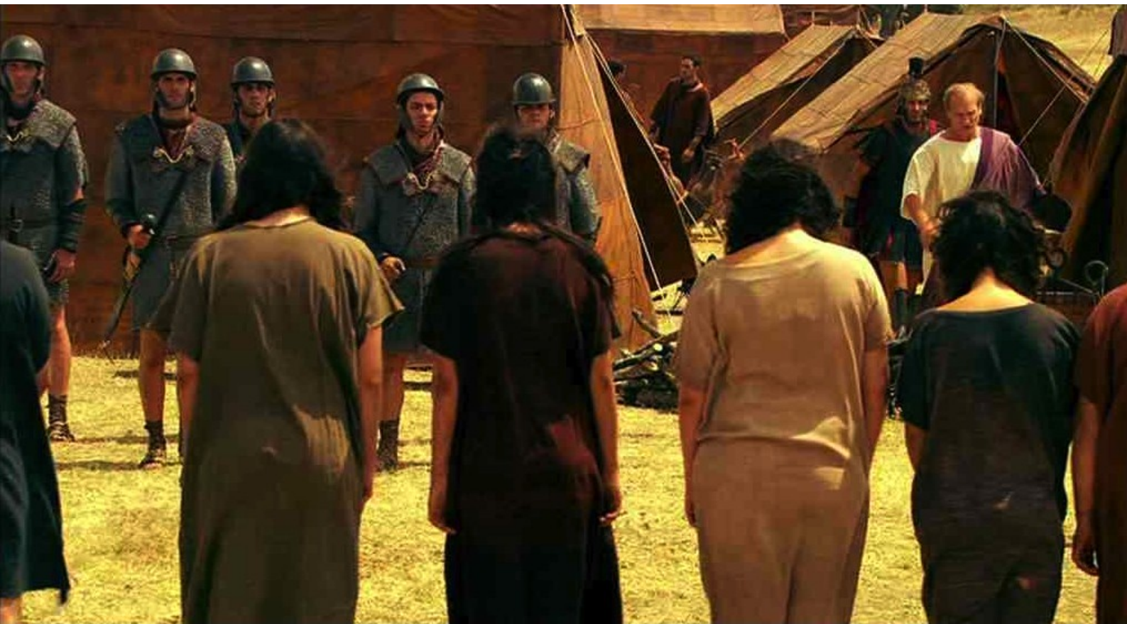
Hispania, la Leyenda : Par ailleurs, les Lusitaniens prisonniers étaient toujours au camp,