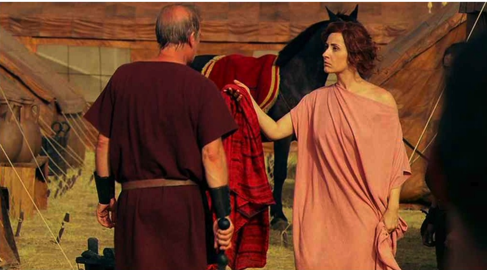
Hispania, la Leyenda : et brandit le vêtement rouge sous son nez avec force reproches.