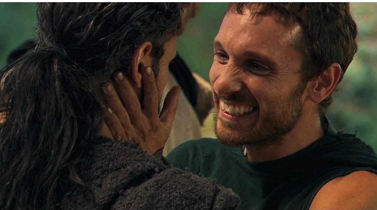
Hispania, la Leyenda : et se fait admettre dans leur bande.