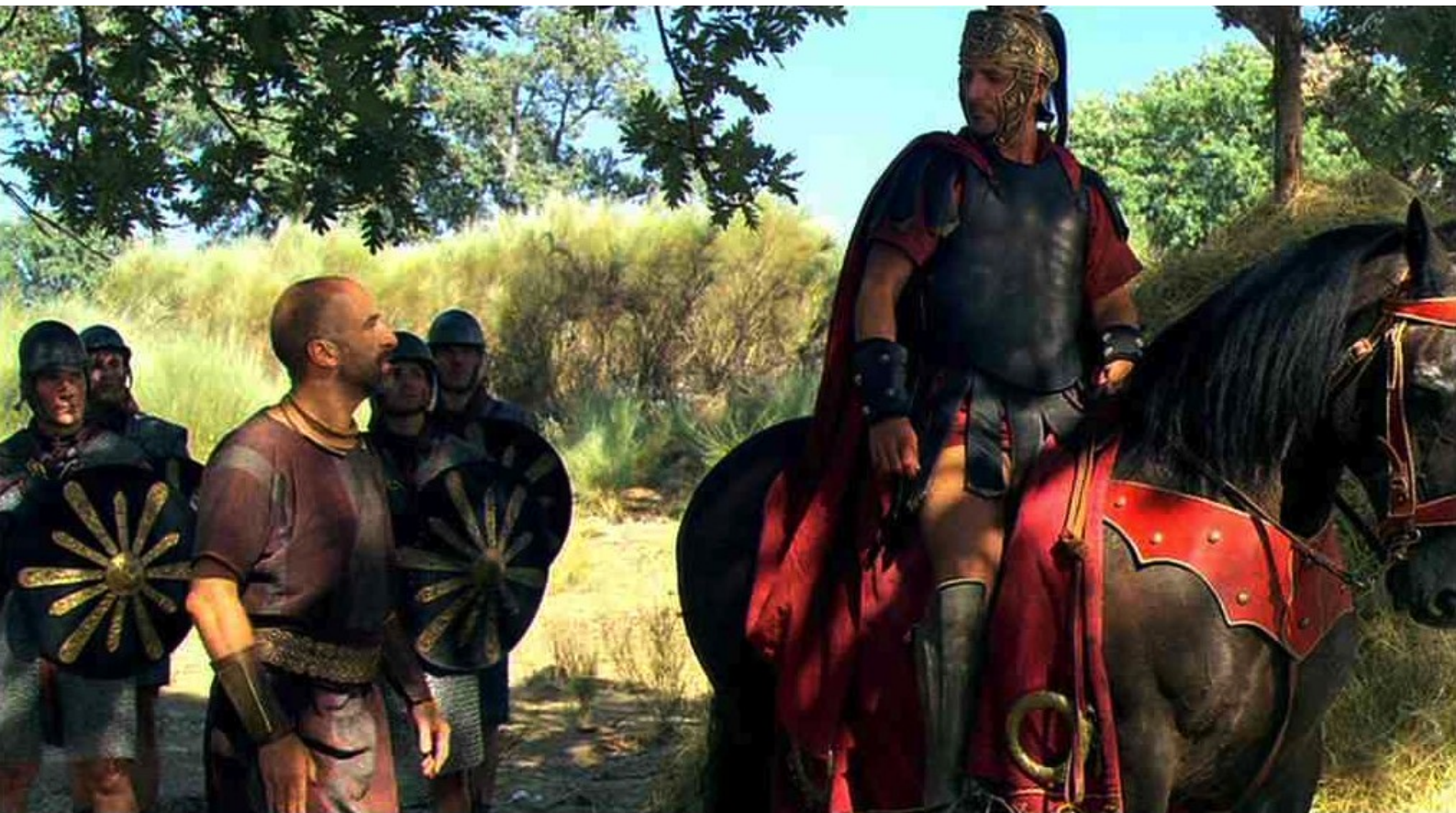
Hispania, la Leyenda : En représailles, Marco va au village,