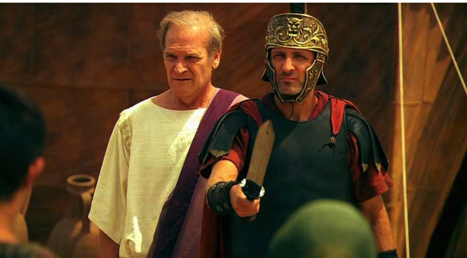
Hispania, la Leyenda : constamment menacés par Galba et Marco.