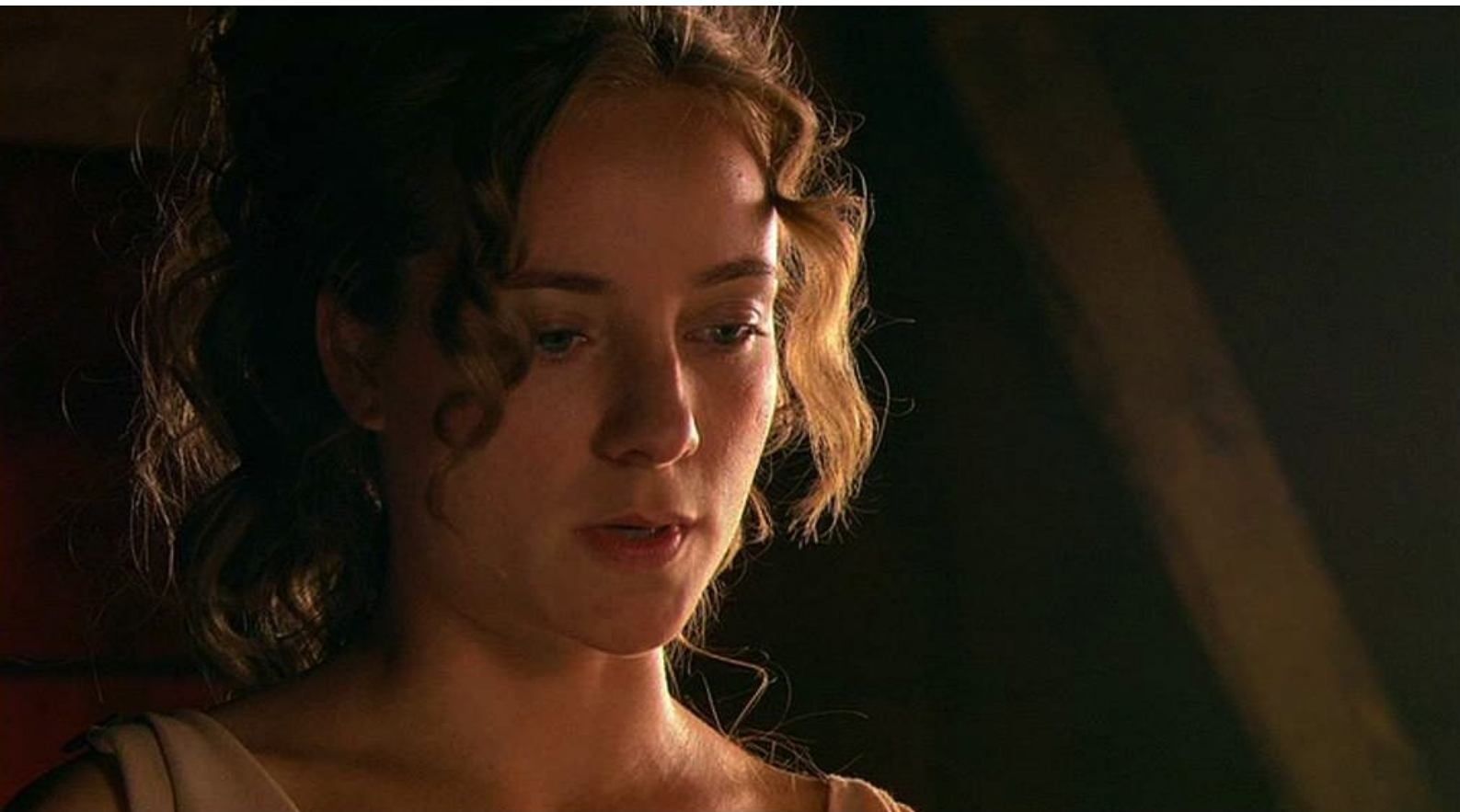
Hispania, la Leyenda : Elle est sauvée de justesse par l'arrivée de Sabina.