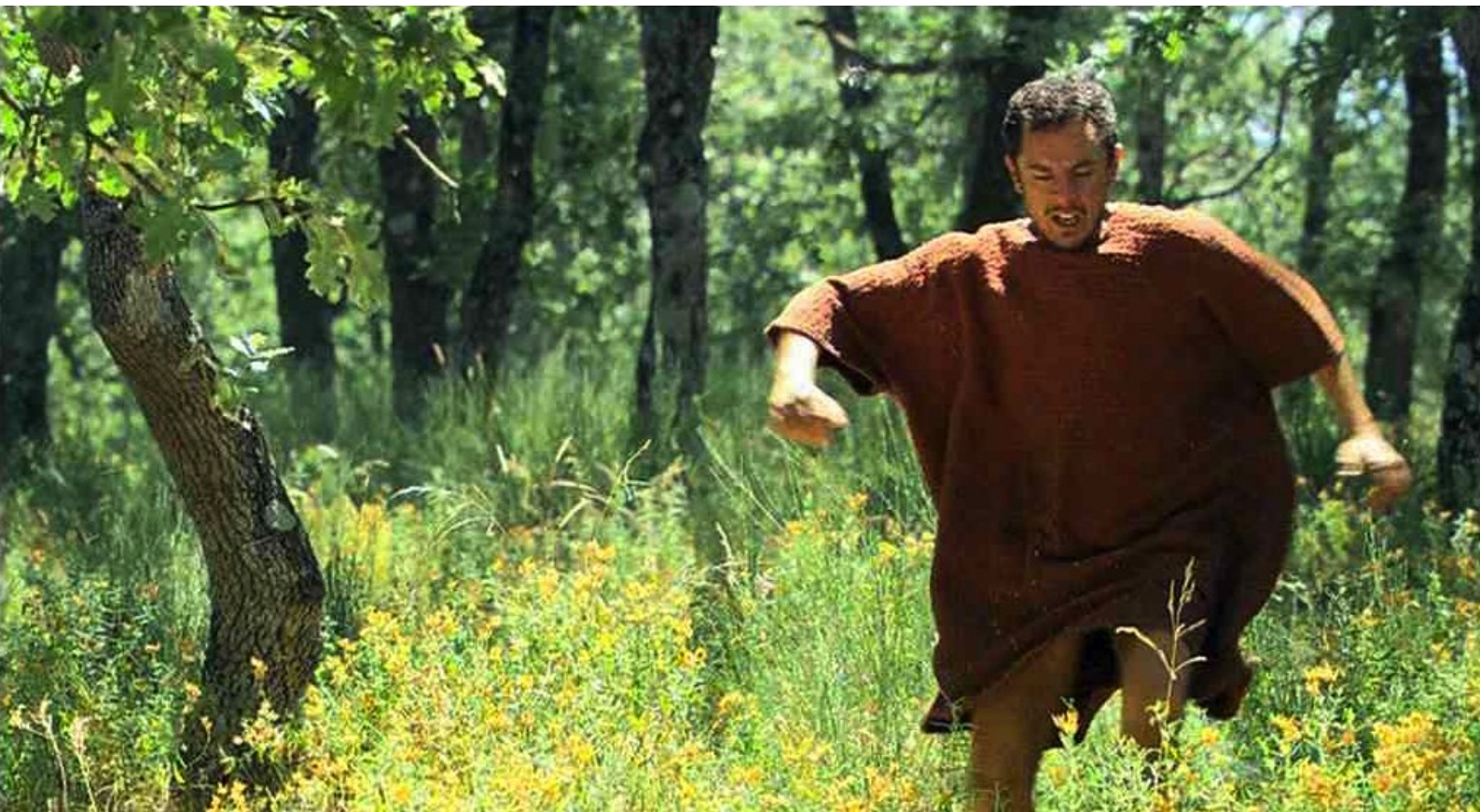
Hispania, la Leyenda : Mais, à peine rétabli, Lucio s'enfuit ;