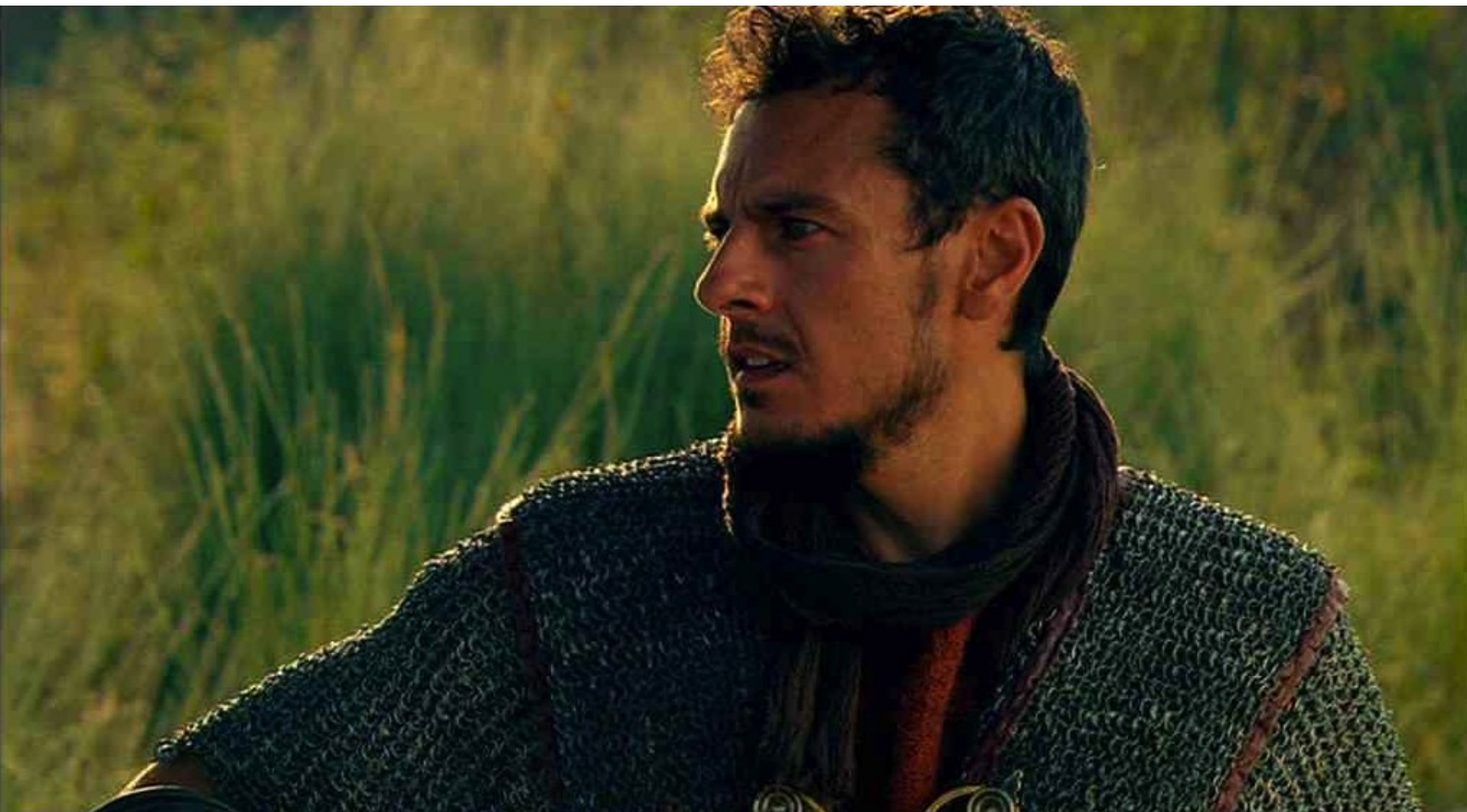
Hispania, la Leyenda : mais il est surpris par le légionnaire Lucio Gabinio ;