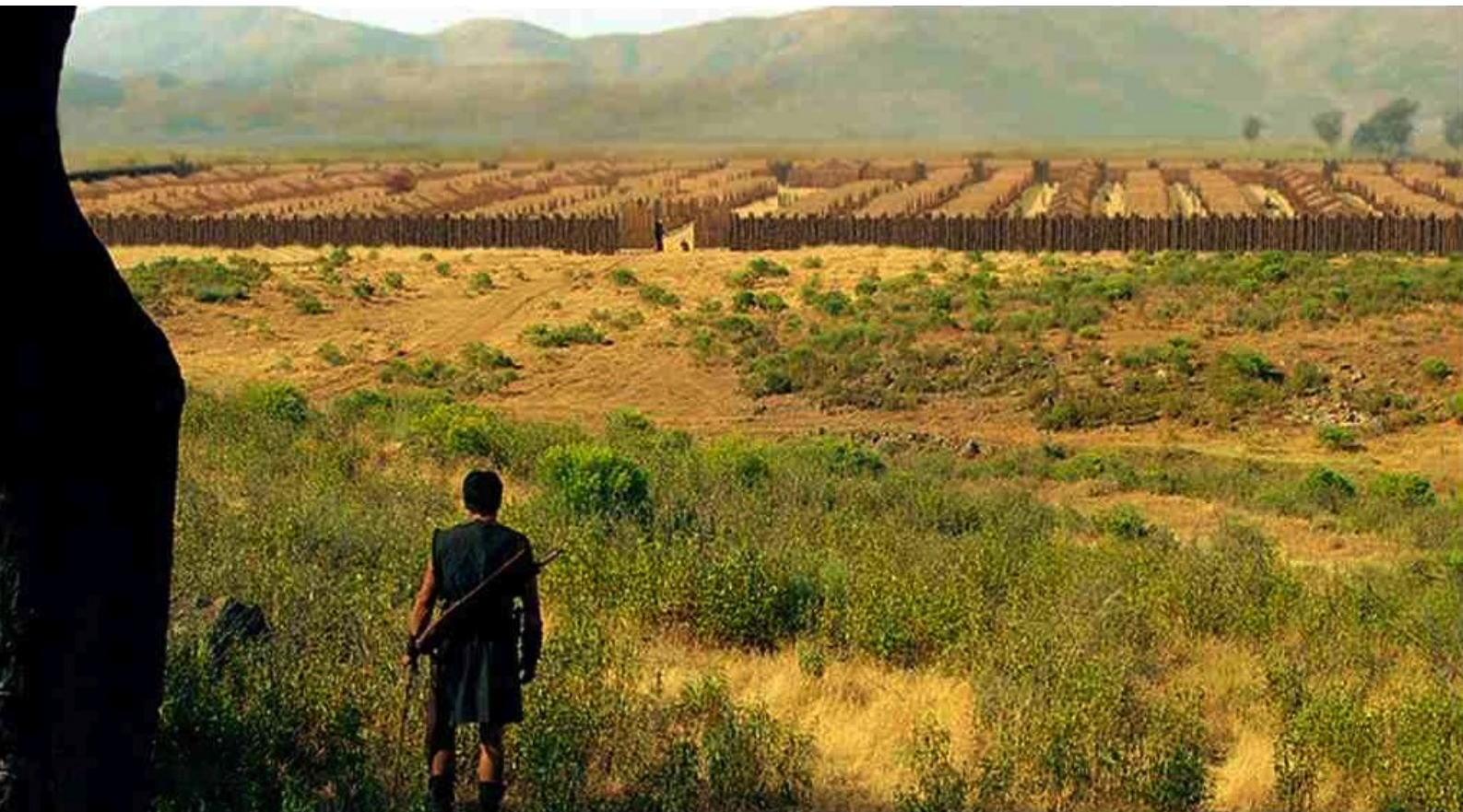
Hispania, la Leyenda : Pendant ce temps, Paulo observe le camp romain,