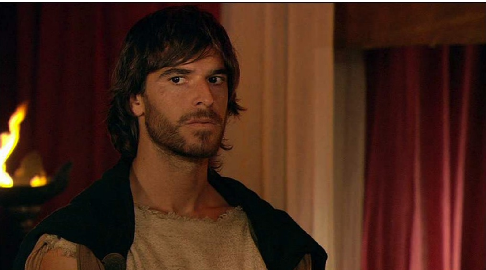
Hispania, la Leyenda : et glaner des renseignements utiles aux rebelles,