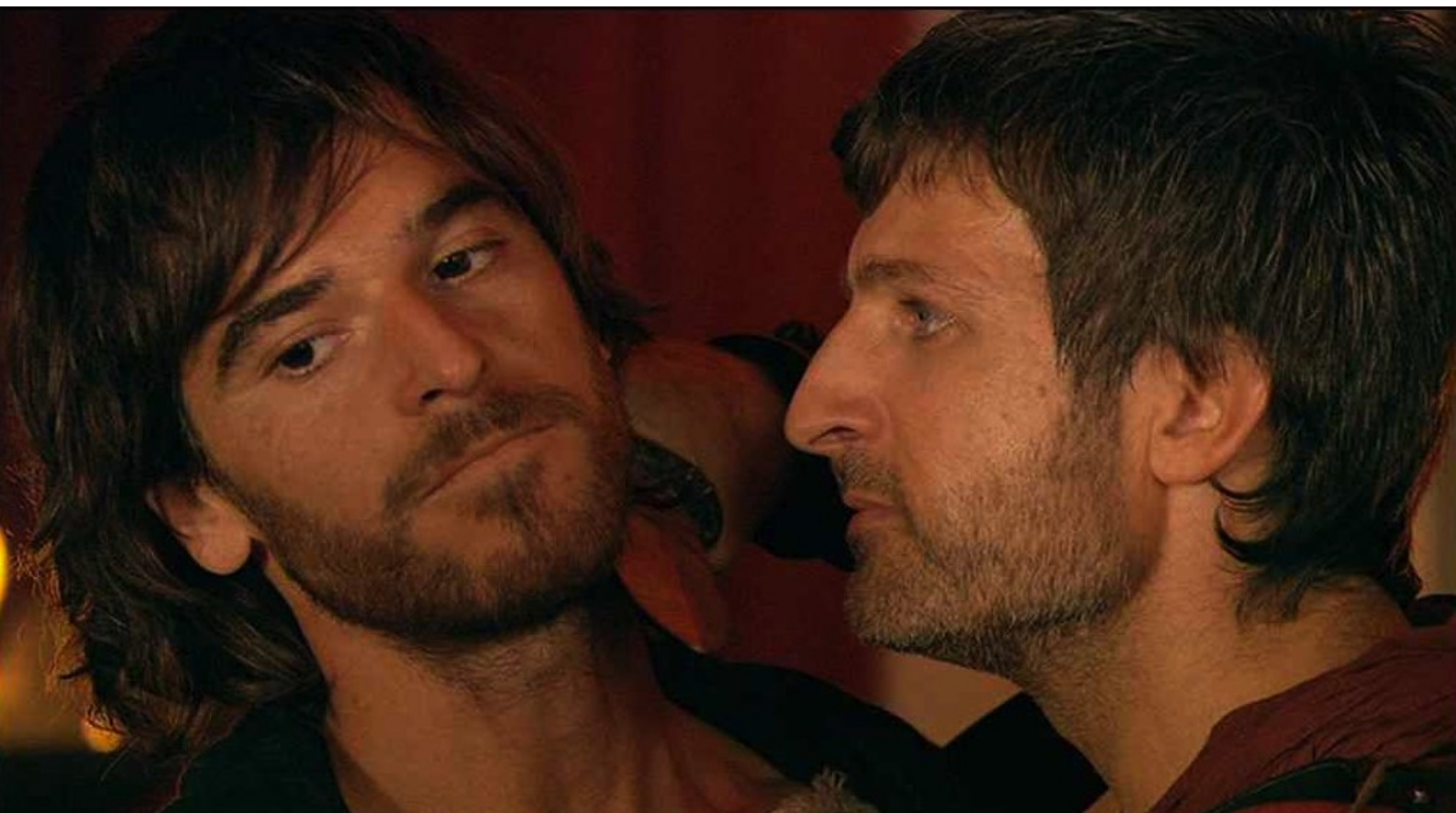
Hispania, la Leyenda : même si l'officier romain Marco le trouve suspect.