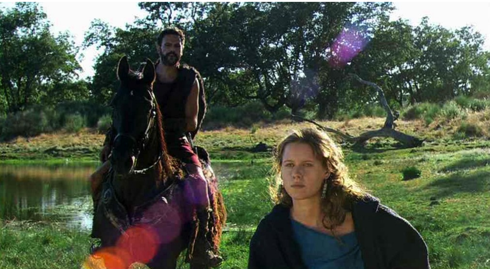
Hispania, la Leyenda : elle le boude, choquée par les horreurs de la guerre.