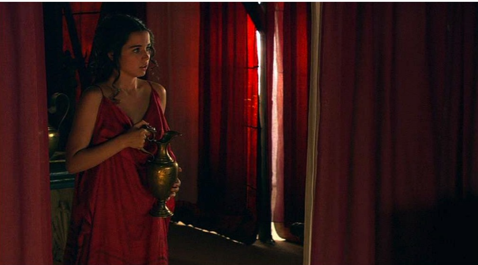
Hispania, la Leyenda : lui donne de beaux vêtements...