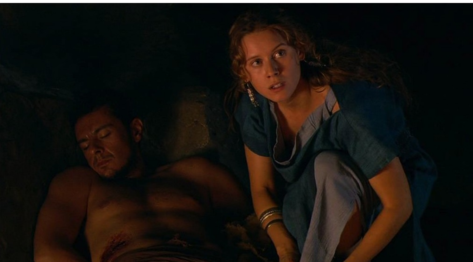
Hispania, la Leyenda : et le soigne tandis qu'il livre des informations sur le camp romain...