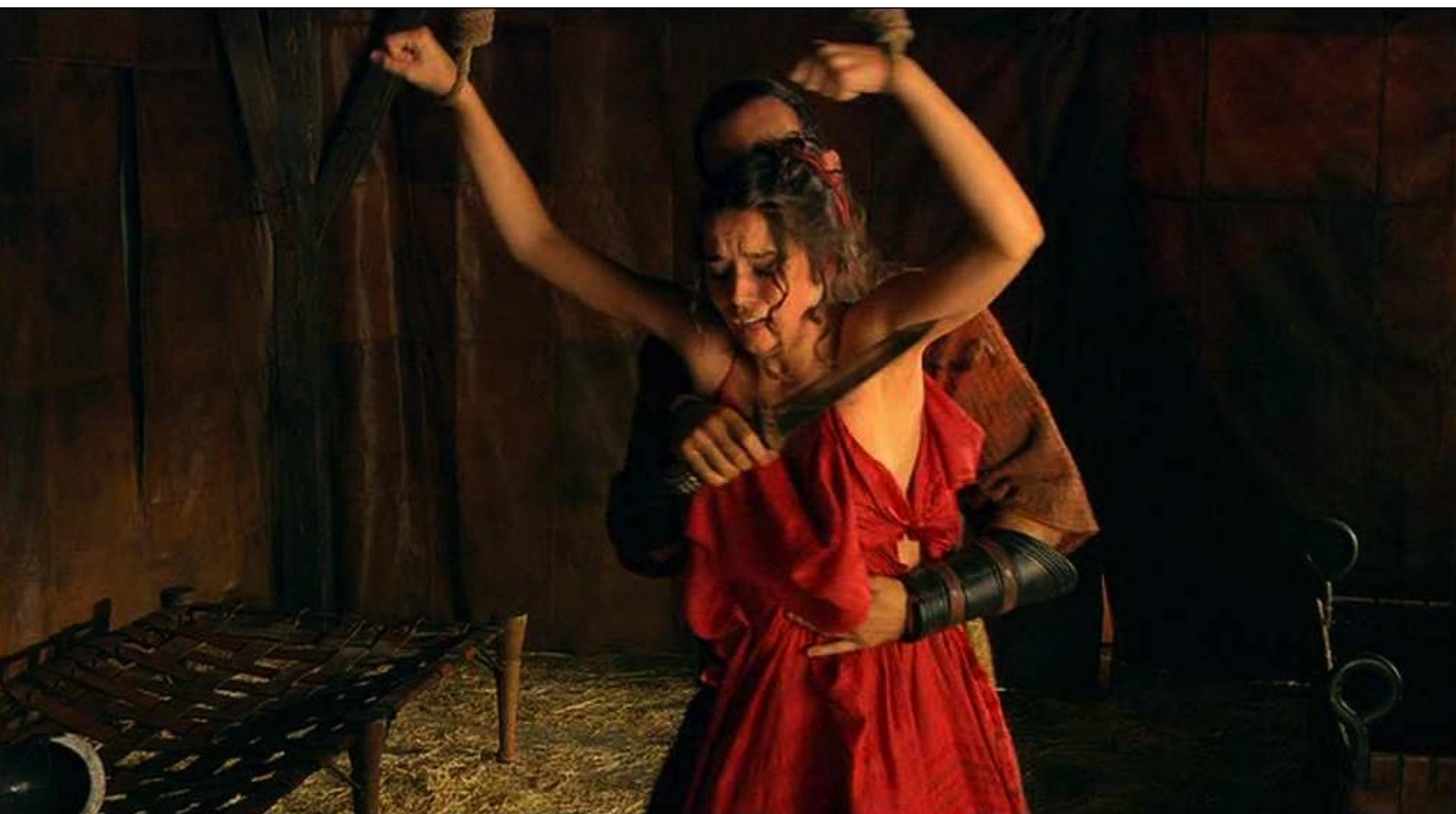
Hispania, la Leyenda : et veut la violer.