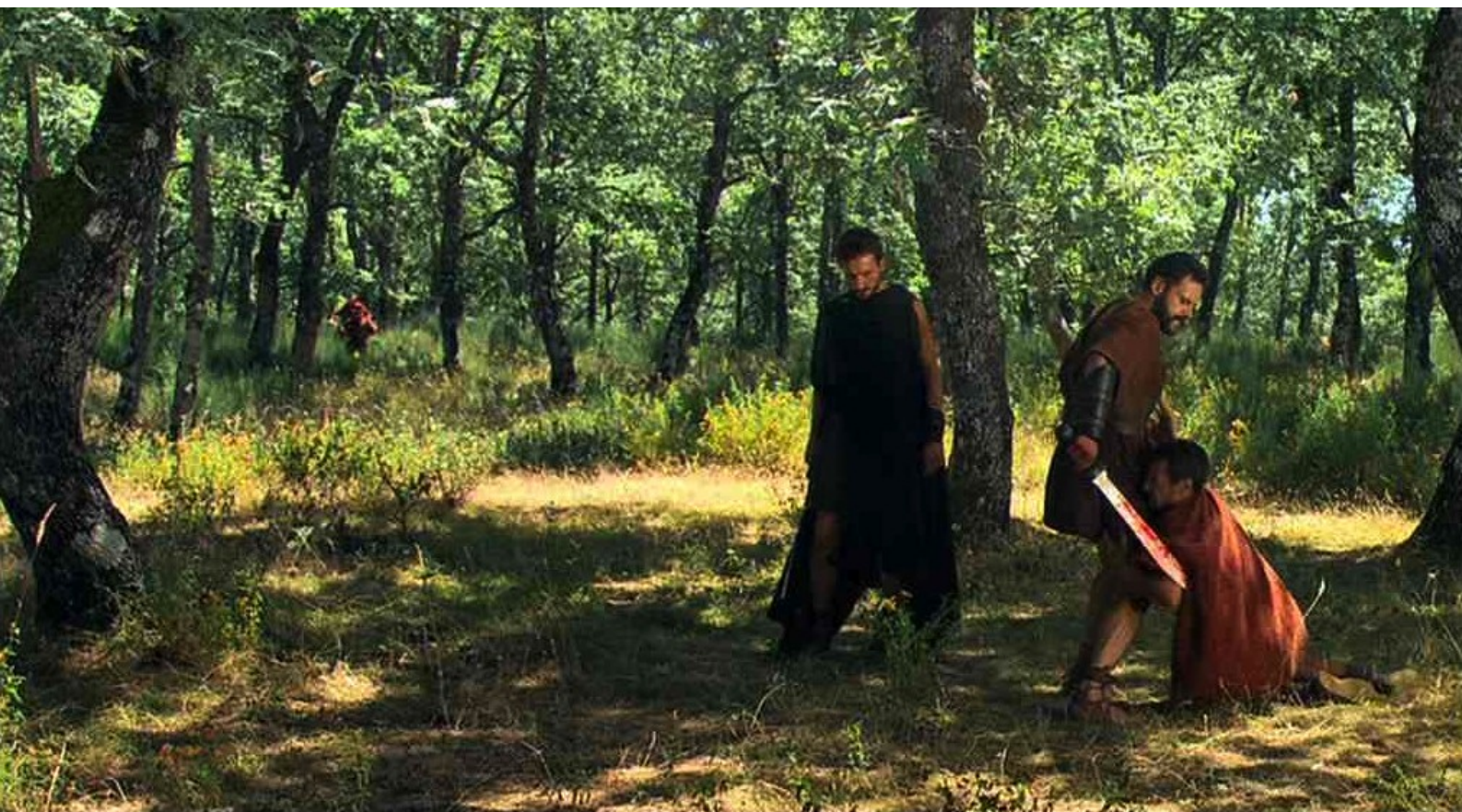
Hispania, la Leyenda : le tuent...