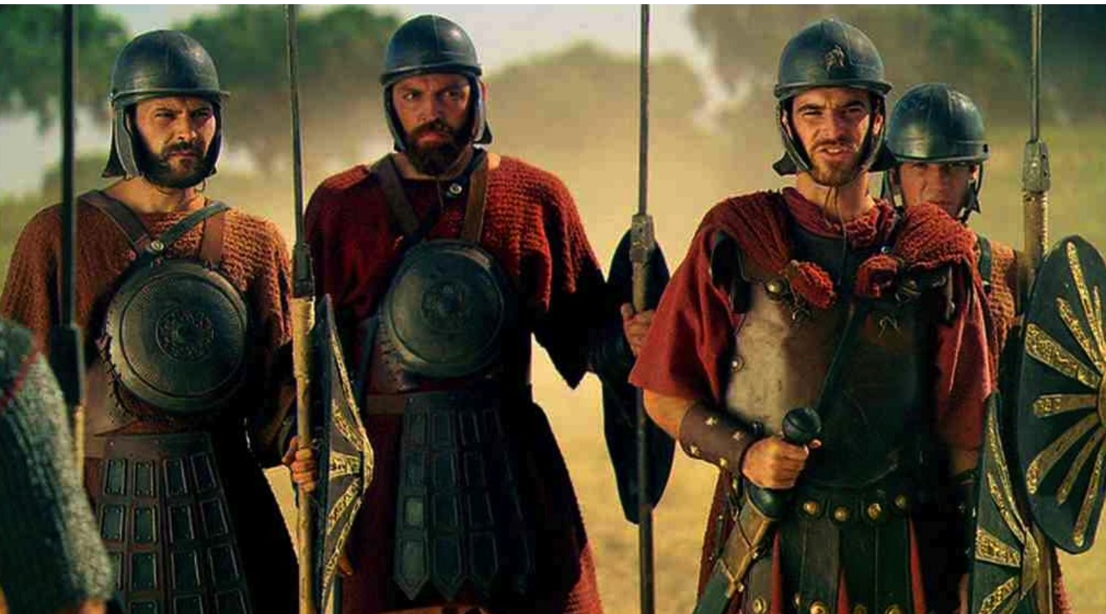
Hispania, la Leyenda : déguisés en légionnaires et ils peuvent ainsi...