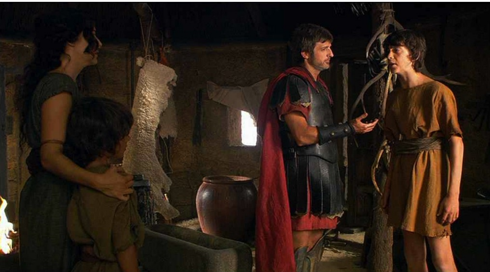
Hispania, la Leyenda : s'approche d'un de ses fils...