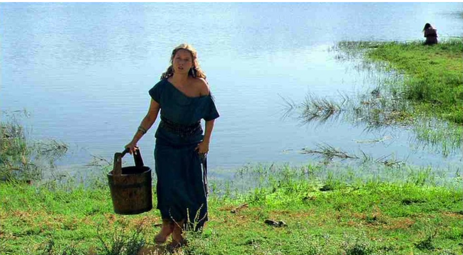
Hispania, la Leyenda : Helena ;