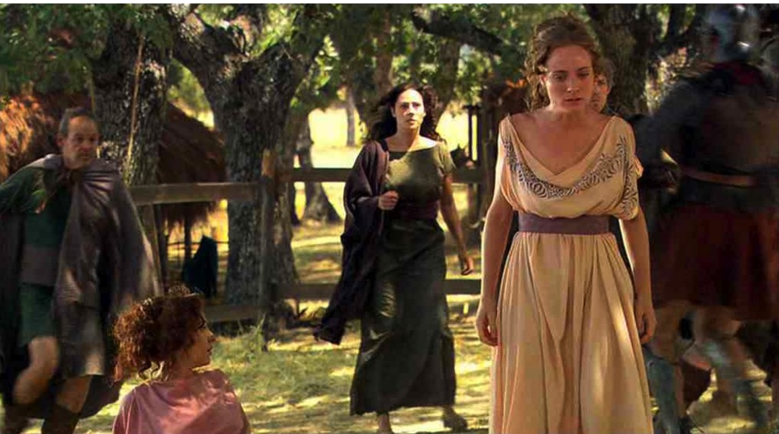
Hispania, la Leyenda : au grand émoi de Sabina...