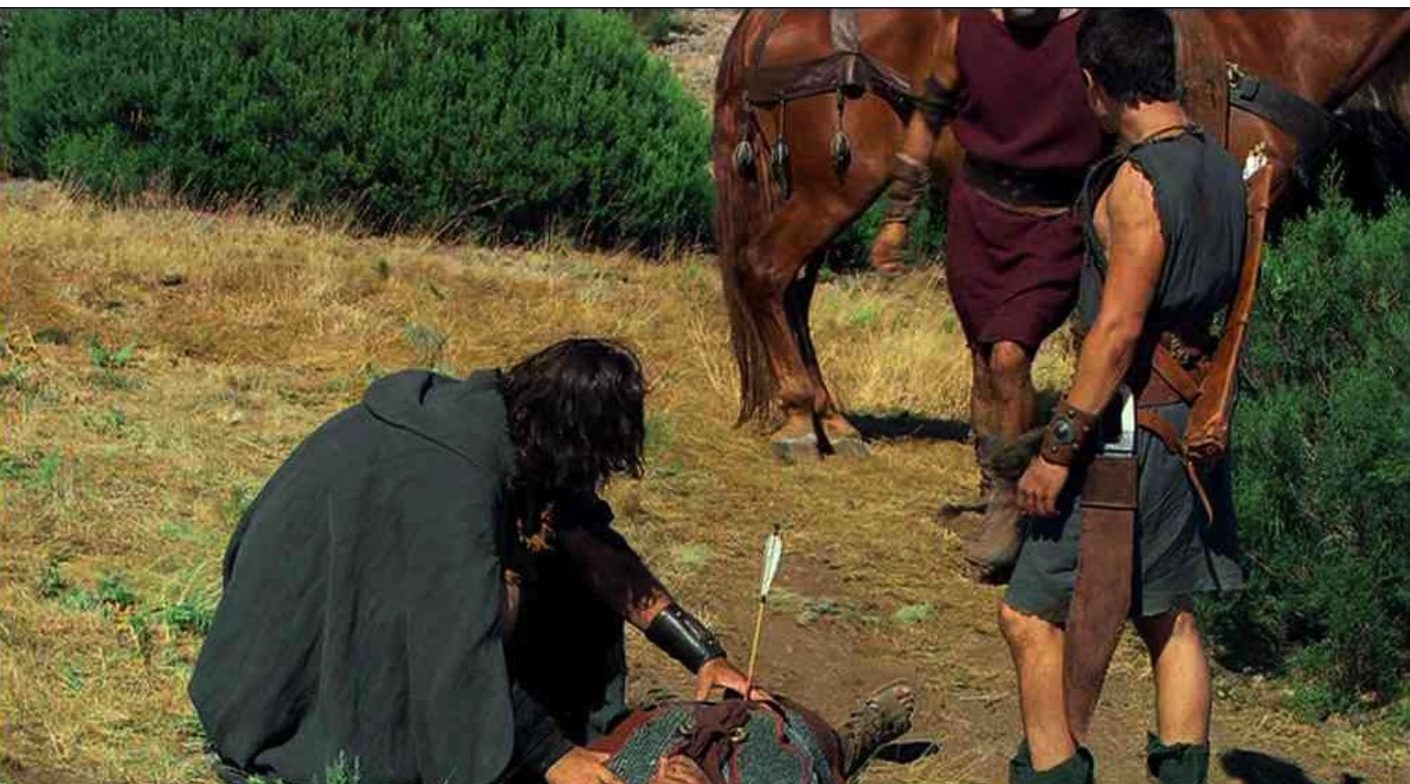
Hispania, la Leyenda : il le blesse d'une flèche et le ramène au repaire des insurgés.