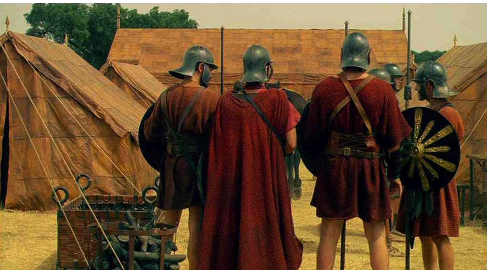
Hispania, la Leyenda : puis ils s'orientent ;