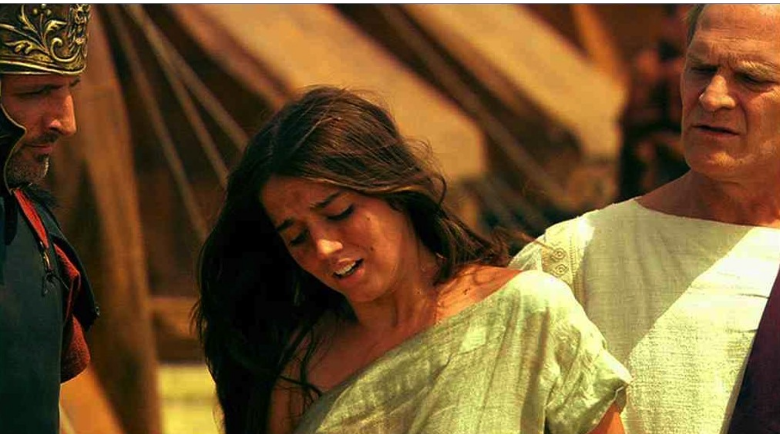
Hispania, la Leyenda : Galba l'examine...