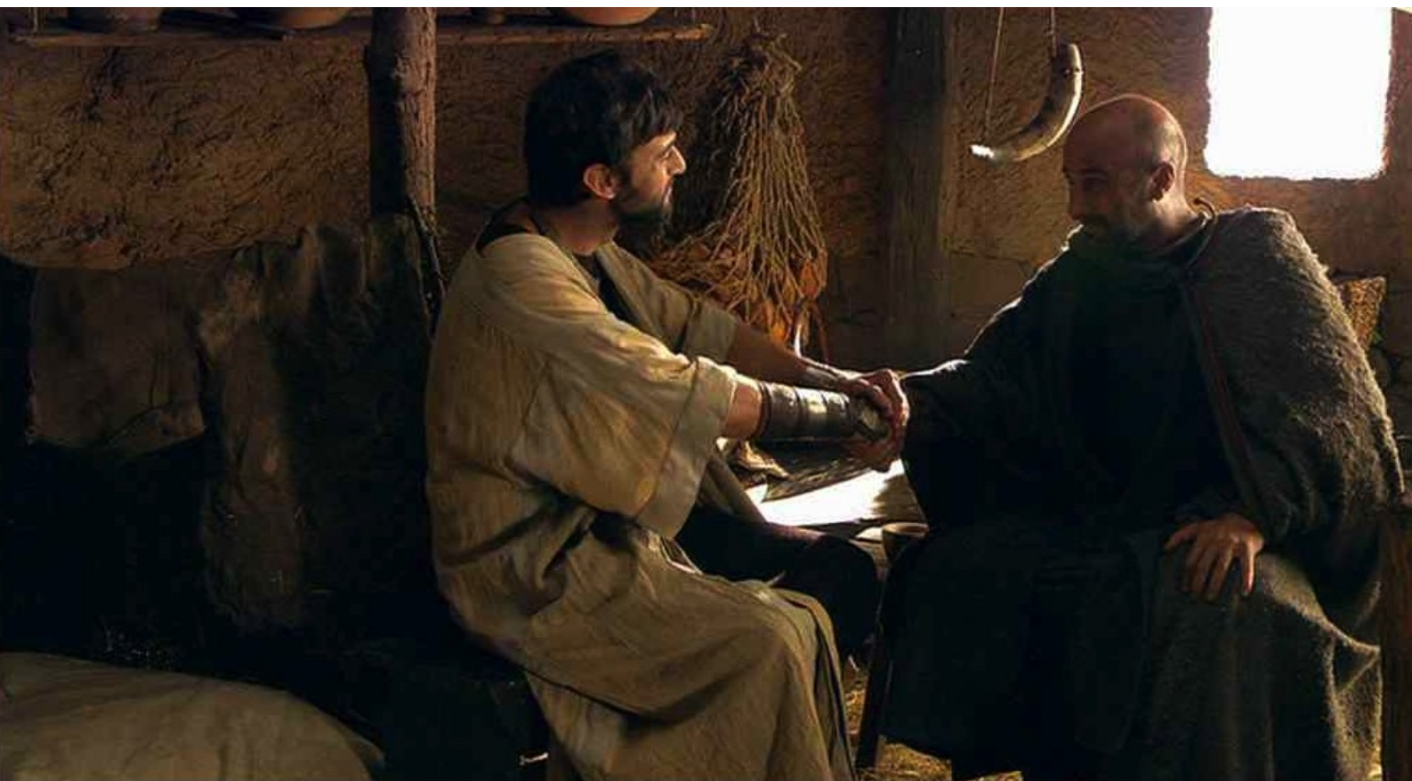
Hispania, la Leyenda : il promet sa fille Helena en mariage au sournois Alejo ;